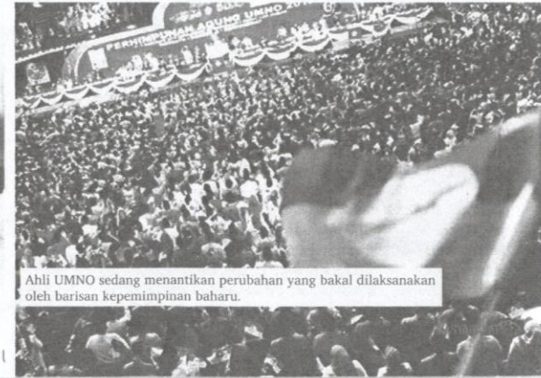
Ahli UMNO sedang menantikan perubahan yang bakal dilaksanakan oleh barisan kepimpinan baharu.