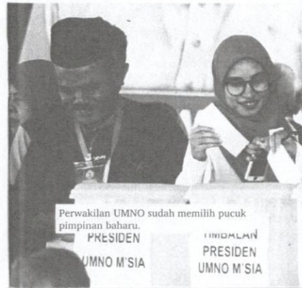
Perwakilan UMNO sudah memilih pucuk pimpinan baharu. PRESIDEN UMNO M'SIA

Untuk itu, Zahid menyatakan bahawa beliau akan mewujudkan Majlis Penasihat Eksekutif UMNO yang dianggotai oleh para ilmuwan, profesional, agamawan,