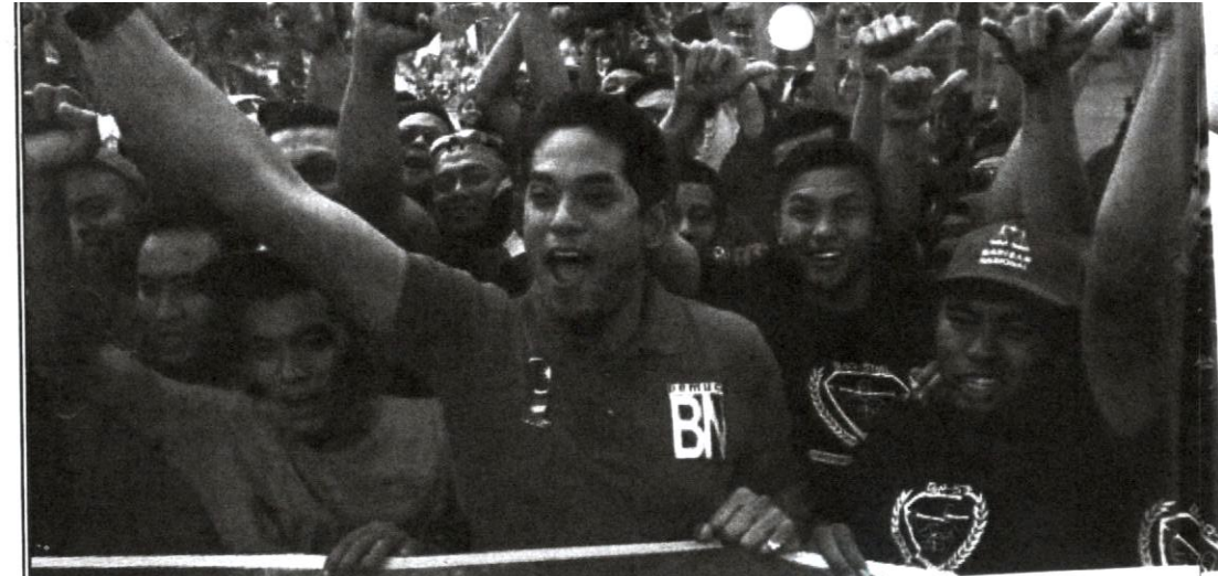
Pemimpin muda mampu menarik perhatian golongan atas pagar.

ialah penanda bahawa penyatuan antara pihak yang bertentangan sedang diusahakan. Kupasan demikian ada kemunasabahannya, kerana pemimpin politik yang mengunjungi dan yang menerima kunjungan tidak sentiasa merupakan musuh ( rival ) politik.