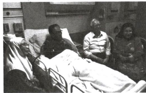
Lawatan perdana menteri dan timbalannya ke HKL mengundang pelbagai reaksi daripada rakyat di negara ini.