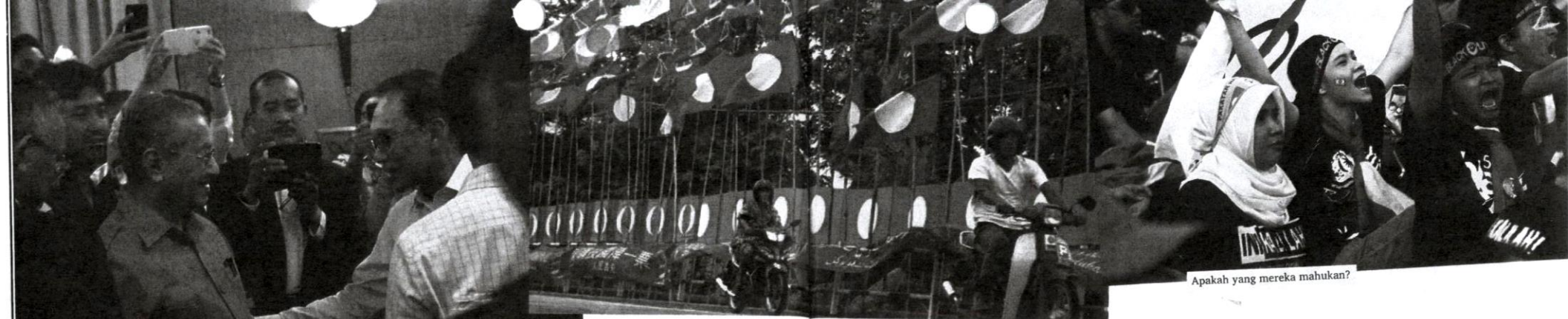
Kedua-dua tokoh ternama ini kembali berdamai selepas perang dingin hampir dua dekad.

Adalah sia-sia jika seseorang itu memaparkan rasa benci yang keterlalu kepada mana-mana pemimpin. Jika pemimpin itu menjadi calon di tempat lain, bukan kawasan si pembenci, lebih besarlah kesia-siaannya. Pemimpin itu tetap akan menang jika disukai oleh sebahagian besar pengundi di kawasannya. Rasa benci yang disuarakan di kedai-kedai kopi dan di kawasan lain tidak akan berkesan.