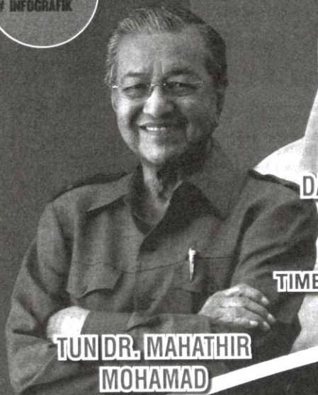
TUN DR. MAHATHIR MOHAMAD PERDANA MENTERI