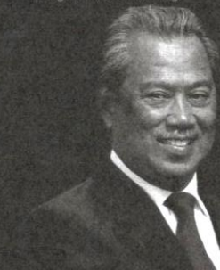
MENTERI DALAM NEGERI

Umur: 64 tahun Asal: Tasek Gelugor, Pulau Pinang Pendidikan: Jurusan Pemakanan Institut Teknologi MARA Pengalaman: • Presiden Parti Amanah Negara (AMANAH) • Ahli Parlimen Kota Raja • Mantan Timbalan Presiden PAS • Mantan Naib Presiden PAS • Mantan Naib Ketua Dewan Pemuda PAS Pusat • Mantan Ahli Parlimen Nilam Puri (1990-1995) Kubang Kerian, Kelantan (1995-1999) dan Kuala Kedah (1999-2004).