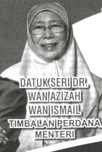
DATUK SERI DR. WAN AZIZAH WAN ISMAIL TIMBALAN PERDANA MENTERI