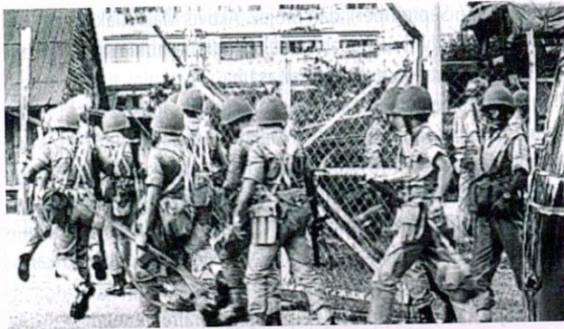
Tentera bertanggungjawab untuk menjaga keamanan negara.

akan menumpukan seluruh tenaga dan usaha kami untuk mencapai cita-cita tersebut berdasarkan atas prinsip-prinsip yang berikut: (1) Kepercayaan kepada Tuhan, (2) Kesetiaan kepada Raja dan Negara, (3) Keluhuran Perlembagaan, (4) Kedaulatan Undang-undang, dan (5) Kesopanan dan Kesusilaan". Hingga kini, tiada pihak yang mempertikaikan hak kebijaksanaan kepemimpinan negara pada tahun 1970 itu yang membuat keputusan bagi pihak setiap rakyat suku kaum masing-masing yang "dipercayai bersetuju" dengan tujuan perpaduan nasional dan keamanan negara pada masa hadapan.