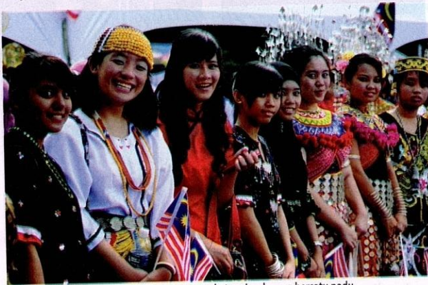
Malaysia bertuah kerana mempunyai masyarakat majmuk yang bersatu padu.

Usaha yang dijalankan termasuklah "Pertandingan Sketsa Rukun Negara", "Pengisahan Kenegaraan", "Pewaris Muda"; projek "Kelab Malaysiaku" yang ditubuhkan di sekolah menengah sebagai satu kegiatan kokurikulum pelajar; "Kem Aspirasi Pelajar" yang bertujuan memupuk dan mendidik semangat jati diri, kerjasama, berdikari serta memupuk keyakinan diri dalam