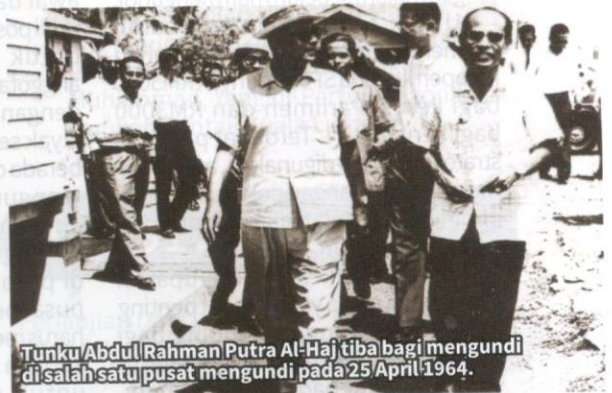
Tunku Abdul Rahman Putra Al-Haj tiba bagi mengundi di salah satu pusat mengundi pada 25 April 1964.