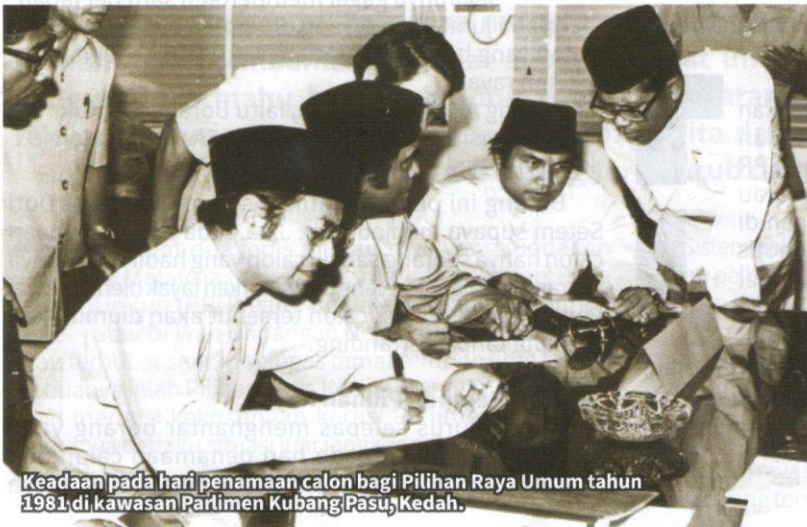
Keadaan pada hari penamaan calon bagi Pilihan Raya Umum tahun 1981 di kawasan Parlimen Kubang Pasu, Kedah.

Pilihan raya yang diadakan di sesebuah negara mencerminkan proses demokrasi yang mengambil berat penglibatan rakyat dalam menentukan masa hadapan negara.