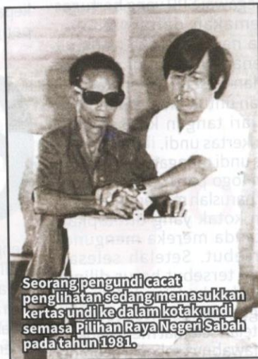
Seorang pengundi cacat penglihatan sedang memasukkan kertas undi ke dalam kotak undi semasa Pilihan Raya Negeri Sabah pada tahun 1981.

Writ merupakan surat kuasa untuk menjalankan pilihan raya akan dikeluarkan oleh SPR dan diserahkan kepada Pegawai Pengurus SPR selepas berlaku pembubaran Parlimen atau DUN atau sekiranya terdapat kekosongan di luar jangka. Serentak dengan itu, satu notis pilihan raya akan diwartakan dan ditampal di tempat yang mudah untuk semakan orang awam. Notis tersebut mengandungi tarikh penamaan calon dan tarikh pengundian. Maka itu, orang awam harus cakna dengan tarikh ini kerana setiap orang hanya mempunyai satu peluang sahaja untuk mengundi pada hari pengundian.