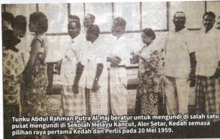
Tunku Abdul Rahman Putra Al-Haj beratur untuk mengundi di salah satu pusat mengundi di Sekolah Melayu Kancut, Alor Setar, Kedah semasa pilihan raya pertama Kedah dan Perlis pada 20 Mei 1959.