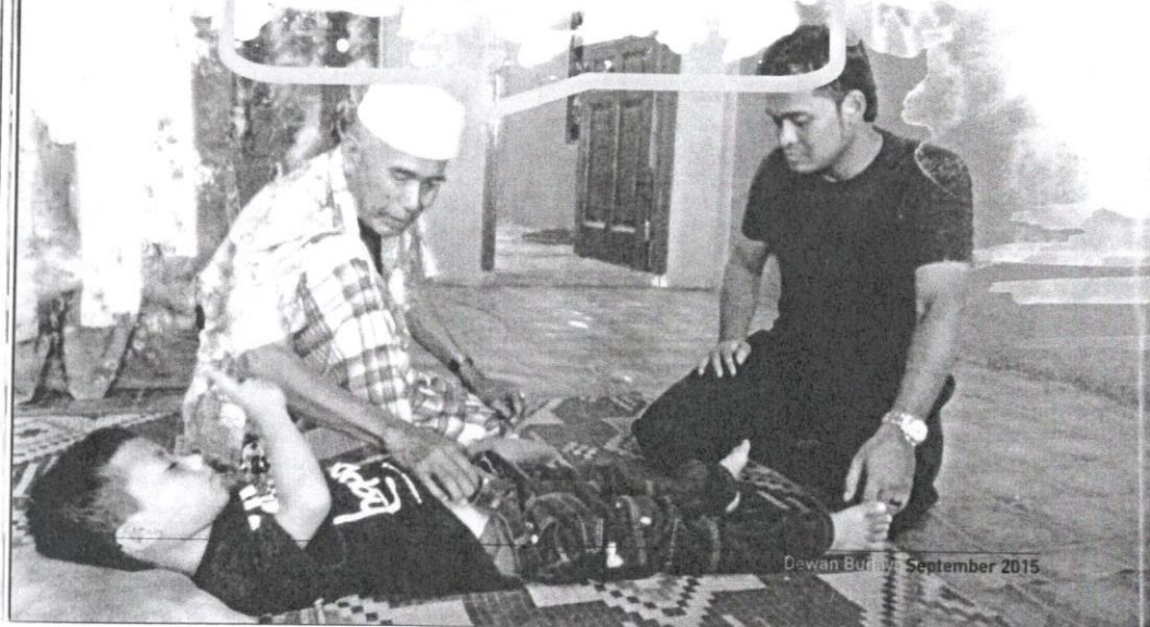
Dewan Budaya, September 2015

serta penggunaan bacaan mantera yang jelas bertuhankan benda lain selain Allah.