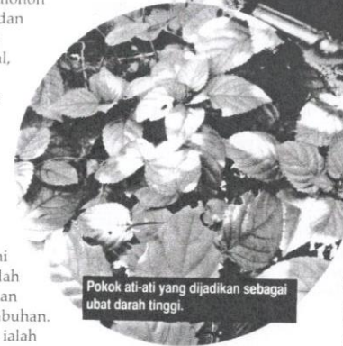
Pokok ati-ati yang dijadikan sebagai ubat darah tinggi.

dapat menyembuhkan pelbagai penyakit, seperti penyakit kulit, luka, asma, alahan, barah, gastrik, resdung, sakit pinggang, sakit sendi, sukar tidur, batuk dan rambut gugur.