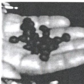
Majun kacip fatimah yang digentel hingga bulat.

Kaedah rebusan sesuai digunakan bagi ramuan herba yang keras, seperti batang, ranting, akar dan buah. Lazimnya, ramuan ini dihiris menjadi serpihan. Setelah itu, ramuan direbus dengan kuantiti air yang hampir memenuhi periuk. Ramuan dibiarkan mendidih hingga kuantiti air rebusan berkurang separuh periuk. Hasil rebusan dapat diminum, sama ada ketika panas atau selepas sejuk. Biasanya, air rebusan ini diminum pada setiap pagi.