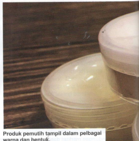
Produk pemutih tampil dalam pelbagai warna dan bentuk.

Petunjuk lain yang mungkin bermakna produk itu ada kandungan merkuri adalah melalui warnanya. Produk yang tinggi merkuri biasanya berwarna keabu-abuan. Namun demikian, tidak