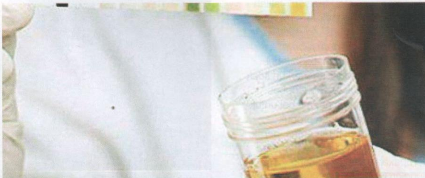
Kandungan merkuri dapat dikesan dalam urin.

Dalam laporan kes yang dilakukan oleh doktor, seorang kanak-kanak berusia 17 bulan mengalami keracunan merkuri akibat pemakaian produk pemutih kulit oleh ibu dan neneknya. Kanak-kanak tersebut menunjukkan pelbagai gejala dan tanda seperti penurunan selera makan, pengurangan berat badan, ketidakupayaan untuk berjalan dan peningkatan tekanan darah. Analisis terhadap produk pemutih kulit yang dipakai oleh ibu dan nenek kanak-kanak tersebut, dapatan menunjukkan bahawa tahap merkurnya yang tinggi, iaitu sebanyak 27 000–34 000 ppm. Tiada sebarang gejala dilaporkan oleh