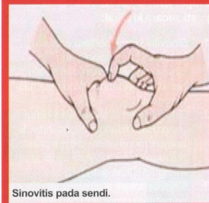
Sinovitis pada sendi.