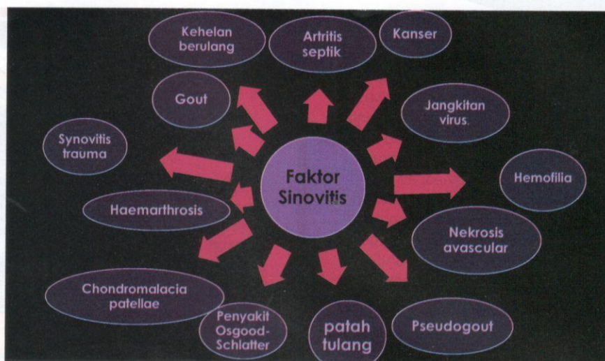
Rajah 1 Faktor yang menyumbang kepada masalah sinovitis.

Terdapat pelbagai faktor yang menjadi penyumbang kepada masalah sinovitis. Faktor pemakanan dan cara hidup yang tidak sihatlah yang merupakan kebanyakan punca penyakit sinovitis ini. Makanan yang diproses dengan bahan kimia yang tidak terkawal dan memakan makanan mengikut nafsu tanpa mengira kemudaratan menjadi masalah kesihatan individu, keluarga, dan masyarakat di banyak negara.