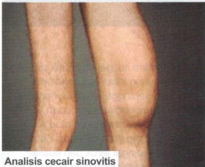
Analisis cecair sinovitis

rawatan konservatif, komplementari/ alternatif dan moden. Rawatan konservatif dilakukan oleh masyarakat dahulu adalah dengan berehat sahaja dan meletakkan ais di sekitar kawasan radangan/bengkak tersebut. Sementara itu, rawatan komplementari atau alternatif pula adalah dengan menggunakan kaedah akupunktur, homeopati dan herba. Rawatan moden pula dengan suntikan steroid yang menggunakan nosteroidal anti-inflammatory drugs atau lebih dikenali sebagai NSAIDs pada sendi yang sakit. Sekiranya