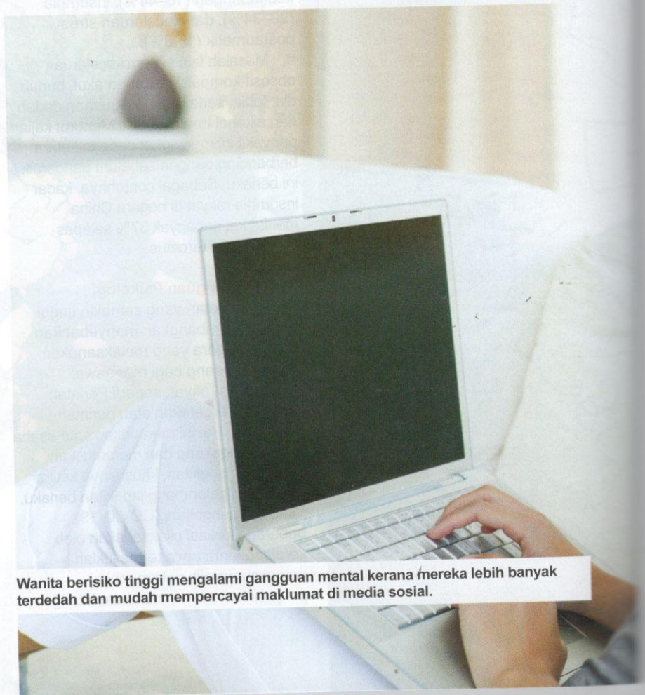
Wanita berisiko tinggi mengalami gangguan mental kerana mereka lebih banyak terdedah dan mudah mempercayai maklumat di media sosial.

COVID-19 juga memberikan impak terhadap ekonomi apabila banyak perniagaan terpaksa ditutup, banyak pekerja terpaksa diberhentikan hingga menyebabkan pendapatan individu dan isi rumah terjejas. Menurut laporan Bank Negara Malaysia, kadar pengangguran meningkat dengan ketara ketika pandemik ini berlaku.