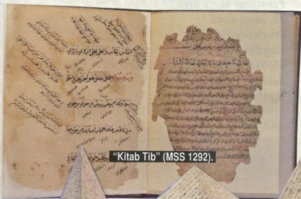
“Kitab Tib” (MSS 1292).

Kitab tib pula ialah khazanah manuskrip Melayu yang mengandungi pelbagai jenis ilmu perubatan orang Melayu terdahulu. Kandungannya meliputi rawatan dan pengubatan pelbagai penyakit jasmani dan rohani, kaedah rawatan, ramuan ubat-ubat, petua, serta pantang larang. Pada asalnya, ilmu ini merupakan hasil transmisi lisan atau khazanah