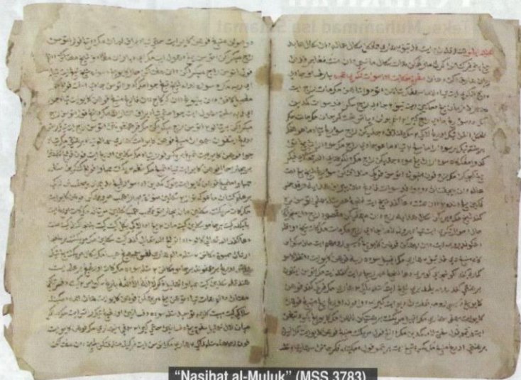
"Nasihat al-Muluk" (MSS 3783).

Tabib: Khabar kepada aku daripada laban al-rakar (getah kayu yang tuha daripada mustaki) jawabnya: darjahnya demikian juga dan penggunaannya jika selalu memakannya nescaya menegah akan lupa dan memudahkan hafaz dan segera faham dan menguatkan gigi dan ia ubat membaiki tulang yang pecah dan menghilangkan bengkak hati dan jika dimakan dua dirham beratnya nescaya menghilangkan ia akan sakit terkena pukul umpama cemeti dan ubat menahankan darah yang keluar dan menghilangkan bengkak dan jika dicelak mata dengan dia nescaya menambah cahaya mata dan jika dimakannya nescaya menghilangkan basah pada kepala dan menghilangkan angin dan memutuskan balgham dan membaiki demam yang jadi daripada balgham dan kata Sayidina Abdullah anak Abas, lazimkan oleh mu dengan kandir iaitu getah leban, ditaruhkan dia di dalam air pada