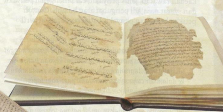
“Kitab Tib” (MSS 1078).