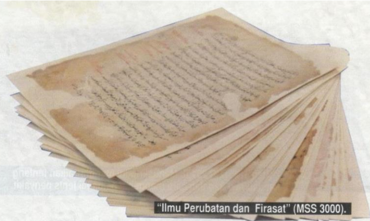
“Ilmu Perubatan dan Firasat” (MSS 3000).

Harun Mat Piah menyatakan bahawa terdapat sekitar 100 buah manuskrip yang tergolong dalam kategori kitab tib, tersimpan di pelbagai koleksi