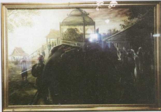
Lukisan yang menggambarkan perarakan Sultan Melaka menaiki gajah untuk mempelajari Islam dan mengaji di Masjid Agung Melaka.

Sultan Mahmud Syah berkenan mencemar duli berangkat ke rumah Maulana Yusuf bagi mempelajari ilmu Fiqh.