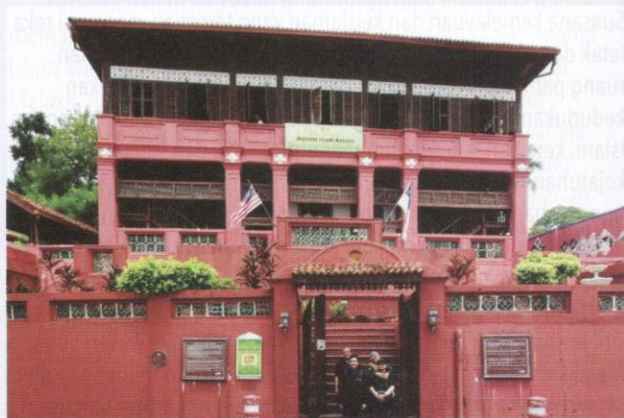
Muzium Islam Melaka di Jalan Kota, Bandar Hilir, Melaka.

Jika reka bentuk luaran muzium ini memperagakan reka bentuk pengaruh Inggeris, reka bentuk dalamnya pula menampilkan identiti Melayu-Islam yang utuh berkonsepkan imbasan suasana kegemilangan Islam di Kepulauan Melayu, terutamanya di Melaka. Himpunan bahan yang dipamerkan bukan sahaja diperagakan dengan kaedah yang berkesan, seperti kaedah berfokus, ringkas dan nyata, bahkan ditampilkan dalam almari perhiasan yang istimewa dengan penerapan motif papan pator rumah tradisional Melayu sebagai bahan dekorasi dan sistem penapisan kesilauan.