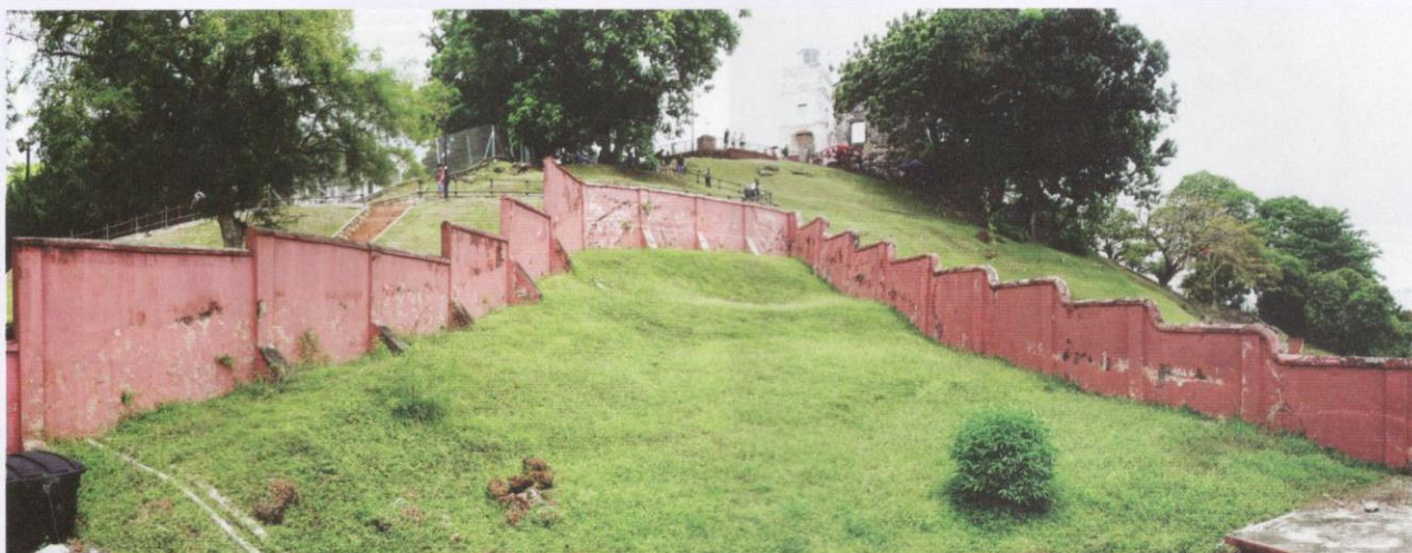
Pemandangan panorama Bukit Melaka yang kini dikenali sebagai Bukit St. Paul.

Kesultanan Melayu Melaka, serta hubungannya dengan pusat tamadun Islam di Asia Tenggara dan negara Arab, Parsi, India, dan China.