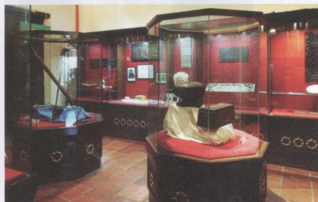
Motif papan pator yang ditemukan pada rumah tradisional Melayu di Air Molek, Melaka digunakan sebagai perhiasan di ruang pameran.

Ruang pameran pertama yang bertemakan "Pengertian Islam" digunakan sepenuhnya bagi tujuan pengenalan kepada intipati Muzium Islam Melaka. Tidak hairanlah replika berukuran besar al-Quran pertama bertulisan tangan yang memperagakan halaman yang berhubung dengan asas penurunan Islam dan kebebasan beragama dijadikan bahan pameran utama di ruang pameran ini. Turut diulas Rukun Islam yang menjadi teras hidup penganutnya beserta hikmah dan kepentingannya.