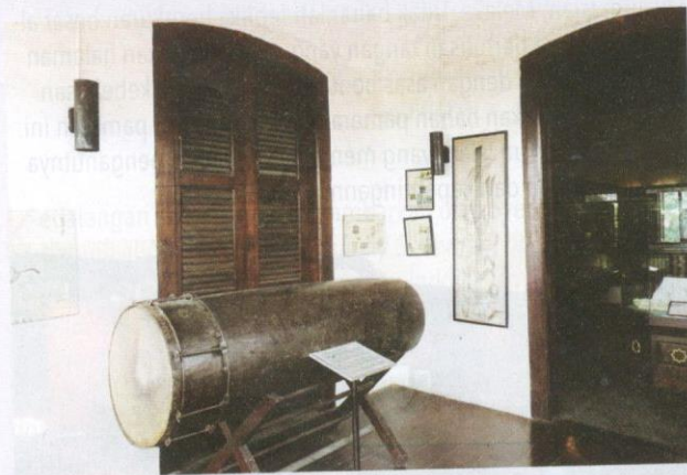
Beduk asal Masjid Kampung Keling yang dipamerkan di tingkat atas ruang pameran keempat.

Rukun Iman yang menjadi panduan hidup penganutnya dan kepentingannya. Antara bahan bersejarah penting yang perlu diteliti di sini termasuklah replika Batu Bersurat Terengganu yang dipamerkan di bahagian luar ruang pameran. Batu yang dijumpai separuh terbenam di tebing sungai Tersat di Kuala Berang pada tahun 1902 ini bukan sahaja memperlihatkan dampak pengislaman di Terengganu pada kurun ke-14 terhadap bahasa Melayu dan tulisan Jawi, malah kedatangan Islam ke Pantai Timur Semenanjung Tanah Melayu itu turut merubah hal ehwal undang-undang perihal maksiat dan kemungkaran setelah Islam menjadi agama rasmi pada tahun 1303.