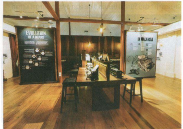
Muzium Telegraf Taiping yang dibina pada tahun 1877.

Taiping juga kaya akan pelbagai resipi makanan dan minuman tempatan dan Barat yang istimewa, enak dan murah. Yang pastinya, para pelancong tidak akan melepaskan peluang untuk menikmati sarapan, makan tengah hari dan makan malam di kedai, gerai makan atau restoran, terutamanya di Medan Selera