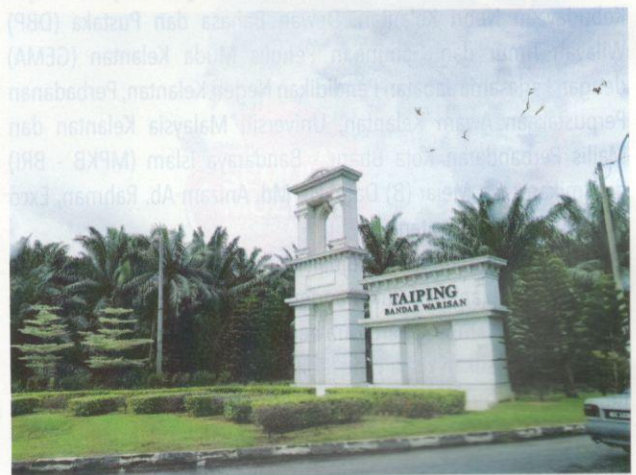
Taiping dikenali sebagai Bandar Warisan.

Jerman, Asian Ecotourism Network, Thailand, Ecotourism Australia, The Long Run, United Kingdom dan Linking Tourism & Conservation (LT&C), Norway.