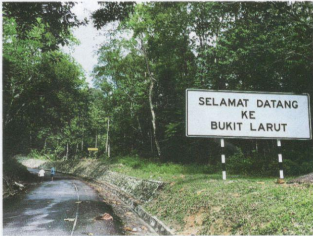
Bukit Larut kaya dengan khazanah flora dan fauna.

Perang Larut. Sebenarnya, Taiping berasal daripada perkataan Cina, iaitu Tai-Peng , yang bermaksud aman selama-lamanya. Keputusan kerajaan British untuk menjadikan Taiping sebagai pusat pentadbiran mereka, bandar yang dahulunya mundur telah berubah menjadi bandar yang maju dan sibuk berbanding dengan bandar-bandar yang lain. Berkembang seiring dengan era kemajuan, wujud rangkaian sejarah yang pertama yang menjadikan Taiping sebagai sebuah bandar yang terkenal di Malaysia sehingga hari ini. Taiping pernah mengambil alih peranan sebagai ibu negeri Perak daripada Kuala Kangsar pada tahun 1876 hingga 1937 sebelum digantikan dengan bandar Ipoh.