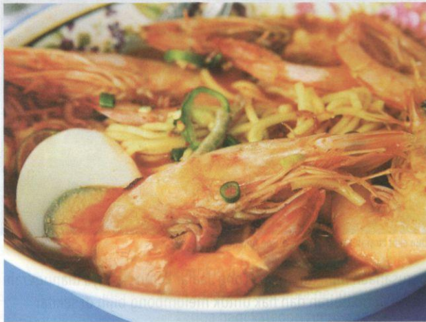
Mi banjir udang merupakan makanan istimewa di Taiping.

Perang Larut. Sebenarnya, Taiping berasal daripada perkataan Cina, iaitu Tai-Peng , yang bermaksud aman selama-lamanya. Keputusan kerajaan British untuk menjadikan Taiping sebagai pusat pentadbiran mereka, bandar yang dahulunya mundur telah berubah menjadi bandar yang maju dan sibuk berbanding dengan bandar-bandar yang lain. Berkembang seiring dengan era kemajuan, wujud rangkaian sejarah yang pertama yang menjadikan Taiping sebagai sebuah bandar yang terkenal di Malaysia sehingga hari ini. Taiping pernah mengambil alih peranan sebagai ibu negeri Perak daripada Kuala Kangsar pada tahun 1876 hingga 1937 sebelum digantikan dengan bandar Ipoh.