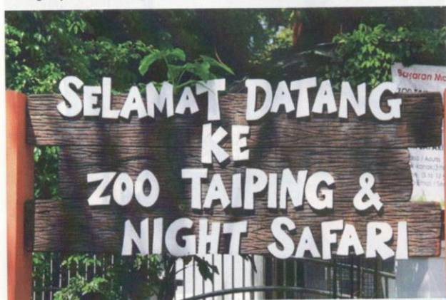
Zoo Taiping mempunyai pelbagai spesies haiwan.

Dari segi latar belakang ekonomi dan sejarahnya pula, daerah Larut, Matang dan Selama merupakan kawasan yang makmur di utara Perak Darul Ridzuan suatu ketika dahulu. Sempadannya menganjur dari Sungai Beruas di selatan hingga Sungai Kerian