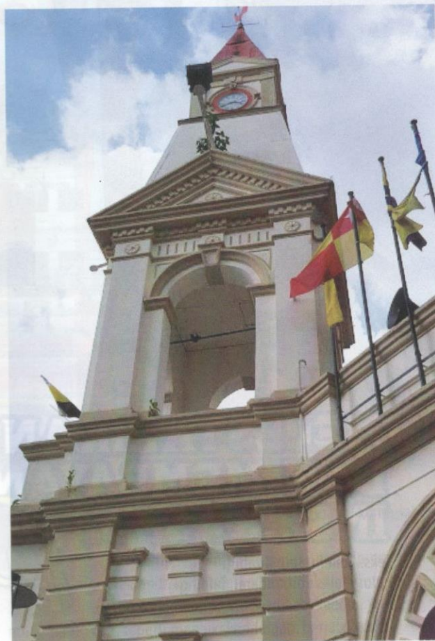
Menara jam di Taiping mempunyai reka bentuk yang unik.

Selain kemudahan seperti Sentral Taiping, Tesco, The Store, Giant, pasar tani, pasar malam, klinik, hospital, reruai cenderamata dan bank, prasarana inap desa, hotel dan tempat penginapan yang bertaraf antarabangsa turut disediakan untuk kemudahan dan keselesaan para wisatawan menelusuri hari-hari atau minggu percutian mereka di bandar bersejarah tersebut. Antara tempat penginapan yang menjadi tumpuan pelancong termasuklah Hotel Flemington, Hotel Taiping Perdana, Kamalodge Café & Resort, Hotel Legend Inn, Hotel Panorama, Vila Sentosa, Hotel Seri Malaysia, Hotel Furama, Hotel SSL Traders, Hotel Meridien, Hotel Novotel, The Regency Hotel Seri Warisan, dan Taiping Golf Resort. Yang pastinya, percutian di Taiping membolehkan para pelancong atau pelawat menghayati keindahan landskap semula jadi, menelusuri warna-warni budaya masyarakat berbilang ras, agama dan latar belakang setempat sekali gus mencatatkan kenangan abadi dalam diari kehidupan masing-masing selagi hayat dikandung badan. Selamat berdarmawisata ke Taiping, sebuah bandar warisan dan destinasi lestari yang terbaik di dunia!