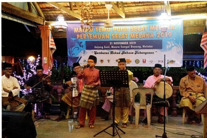
Malam Temu Puisi Selat Melaka sempena Pertemuan Selat Melaka 2019.

"Institusi kesultanan di Melaka banyak memainkan peranan dalam sistem pentadbiran negeri itu. Pada masa itu, Melaka bukan sahaja sebagai tempat kapal berlabuh, tetapi juga sebagai tempat penyebaran budaya daripada