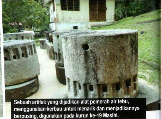
Sebuah artifak yang dijadikan alat pemerah air tebu, menggunakan kerbau untuk menarik dan menjadikannya berpusing, digunakan pada kurun ke-19 Masihi.

Pemerintahan Sultan Mudzafar Shah I digantikan oleh anakandanya dengan memakai gelaran Sultan Muadzam Shah yang memerintah dari tahun 1179 hingga 1201. Salasilah kesultanan negeri Kedah tidak putus sehingga kepada sultan ke-28, KDYMM Al-Aminul Karim Sultan Sallehuddin ibni Almarhum Sultan Badlishah.