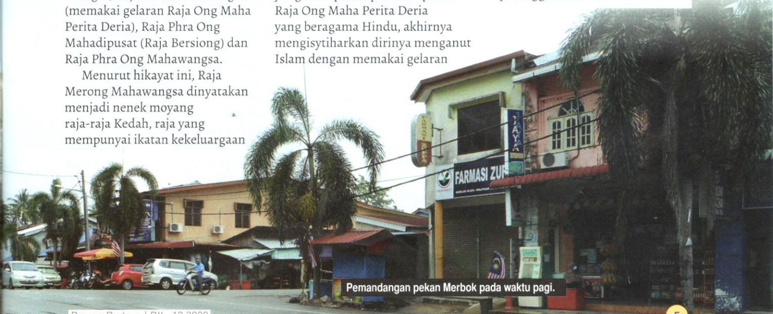
Pemandangan pekan Merbok pada waktu pagi.

Sultan Mudzafar Shah I. Baginda yang mendapat bimbingan dan pengaruh, diislamkan oleh Syekh Abdullah al-Yamani diiktiraf sebagai Sultan Kedah pertama pada tahun 1136. Dengan pengislaman Sultan Mudzafar Shah I, maka berakhirlah pengaruh Hindu dan Buddha dalam pemerintahan negeri Kedah. Baginda memerintah Kedah selama 43 tahun dan mangkat pada tahun 1179. Jenazah baginda dimakamkan di Kg. Langgar, Mukim Bujang, Kedah dan makamnya masih terjaga rapi hingga kini.