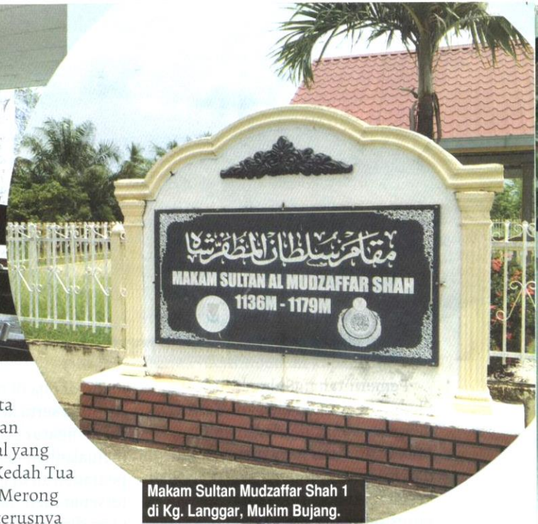
Makam Sultan Mudzaffar Shah 1 di Kg. Langgar, Mukim Bujang.

tersebut dikatakan menjadi pusat dagangan kuno, tempat persinggahan kapal dagangan, iaitu tempat ditemui bukti lima hingga tujuh buah kapal dagangan berusia kira-kira 2500 tahun yang tertanam di hutan kelapa sawit di sekitar Lembah Bujang. Gunung Jerai yang terletak di utaranya menjadi petunjuk arah kepada pelayar dan pedagang melakukan persinggahan di rantau ini.