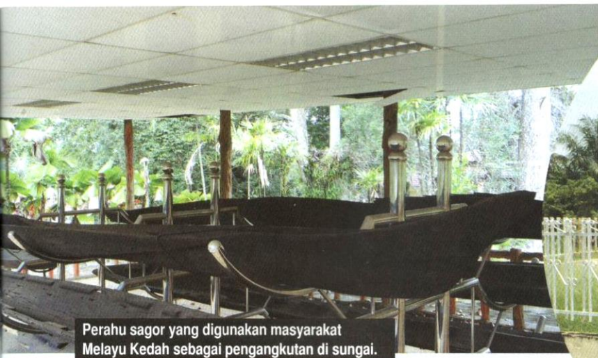
Perahu sagor yang digunakan masyarakat Melayu Kedah sebagai pengangkutan di sungai.