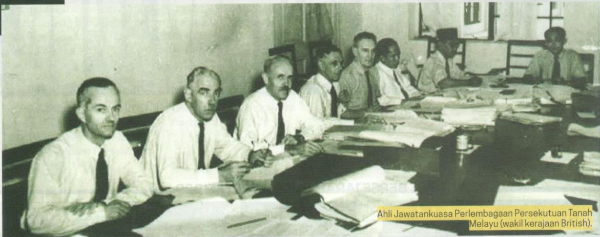
Ahli Jawatankuasa Perlembagaan Persekutuan Tanah Melayu (wakil kerajaan British).

ini. Memorandum tersebut hadir dari pelbagai sumber termasuklah daripada Raja-raja Melayu, orang perseorangan dan parti-parti politik. Hasil daripada kajian yang dijalankan melalui memorandum – memorandum yang diterima, sebuah Penyata Suruhanjaya Reid diterbitkan pada 21 Februari 1957. Terdapat 100 perkara yang disentuh melalui penyata ini. Antaranya termasuklah mengenai pembentukan Parlimen, perantaraan Yang di-Pertuan Agong dan Timbalan Yang di-Pertuan Agong sebagai Ketua Negara dan Timbalannya, kuasa-kuasa Parlimen, kuasa-kuasa Yang di-Pertuan Agong, kedudukan dan kuasa Raja-raja Melayu, perantaraan Perdana Menteri, hal-hal kerakyatan, hak-hak asasi rakyat, hak-hak istimewa orang Melayu, pilihan raya, bahasa dan agama rasmi negara dan lain-lain.