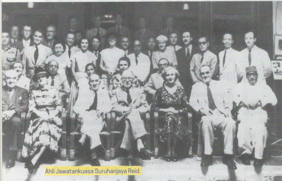
Ahli Jawatankuasa Suruhanjaya Reid.