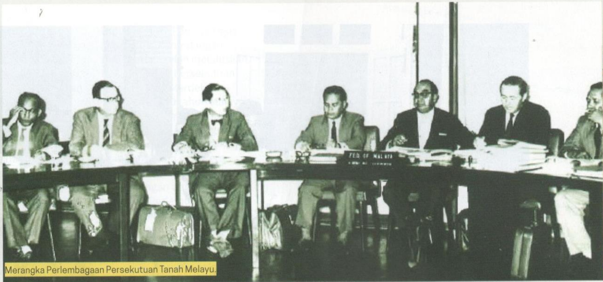
Merangka Perlembagaan Persekutuan Tanah Melayu.