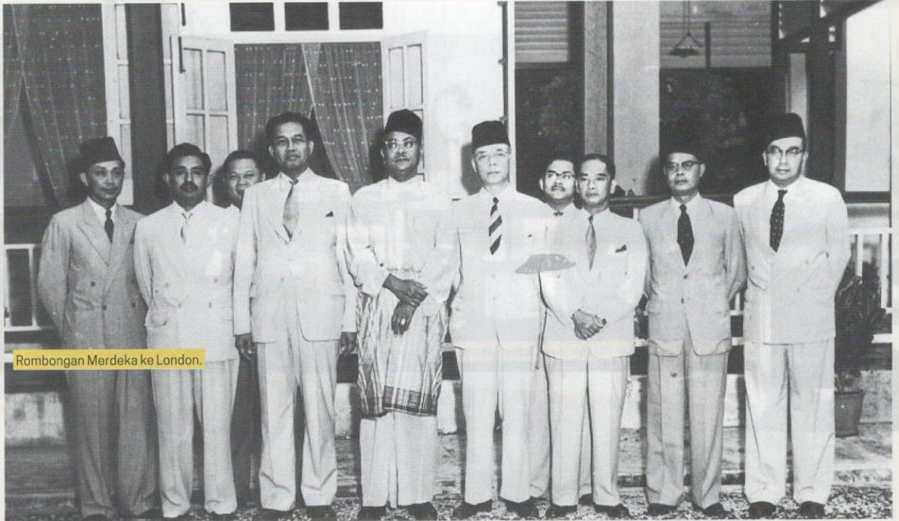
Rombongan Merdeka ke London.