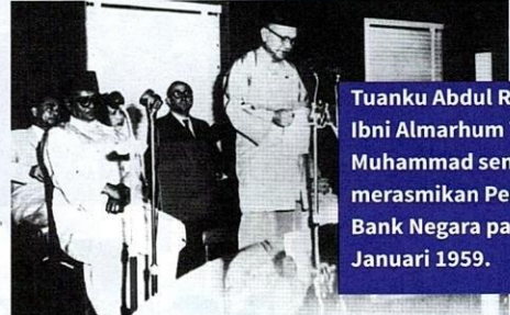
Tuanku Abdul Rahman ibni Almarhum Tuanku Muhammad semasa merasmikan Pembukaan Bank Negara pada 24 Januari 1959.

Besar Negeri Sembilan yang baharu pada 3 Ogos 1933, ketika baginda berusia 38 tahun.