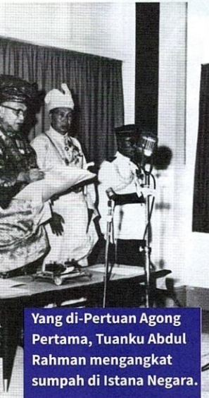
Yang di-Pertuan Agong Pertama, Tuanku Abdul Rahman mengangkat sumpah di Istana Negara.