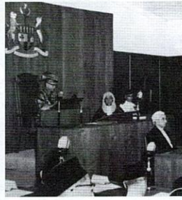
Tuanku Abdul Rahman ibni Al Marhum Tuanku Muhammad, sedang bertitah di Majlis Pembukaan Federal Legislative Council pada 3 September 1957.