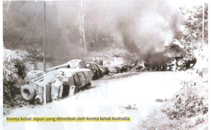
Kereta kebal Jepun yang ditembak oleh kereta kebal Australia.

berjuang habis-habisan. Keberanian Leftenan Adnan telah menaikkan semangat askar lain untuk terus berjuang.