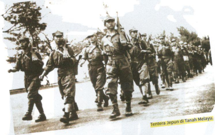
Tentera Jepun di Tanah Melayu.