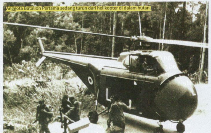
Anggota Batalion Pertama sedang turun dari helikopter di dalam hutan.