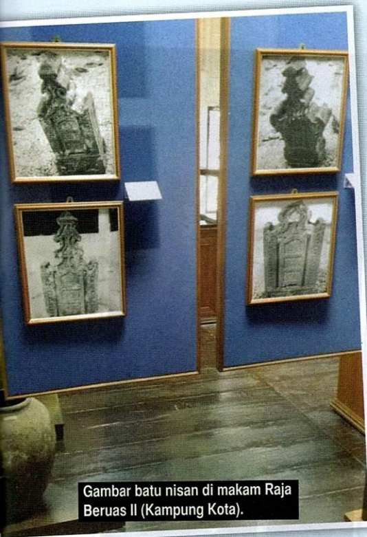
Gambar batu nisan di makam Raja Beruas II (Kampung Kota).

Kali terakhir kita mendengar kisah Kerajaan Manjung adalah semasa Sultan Mahmud Shah memerintah Bentan. Apabila Melaka ditewaskan oleh Portugis pada tahun 1511, Raja Beruas yang turut memerintah Manjung datang menghadap Sultan Mahmud Shah untuk menyembahkan taat setianya. Apabila Bentan diserang dan dikalahkan oleh Portugis pada tahun 1526, Sultan Mahmud Shah berundur ke Kampar. Sejak itu, tiada