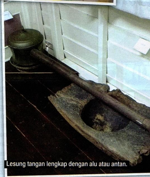
Lesung tangan lengkap dengan alu atau antan.

Namun begitu, penemuan arca-arca Buddha menunjukkan Kerajaan Gangga Negara berpusat di Beruas pada abad ke-5 dan ke-6 Masihi. Ada pula pihak yang berpendapat kerajaan ini wujud