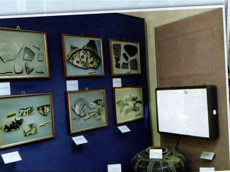
Pecahan seramik jenis coklat (atas kiri), pecahan seramik jenis biru dan putih, serpihan seramik biru dan putih, dan ketulan besi.