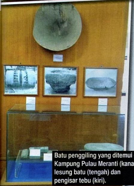
Batu penggiling yang ditemui di Kampung Pulau Meranti (kanan), lesung batu (tengah) dan pengisar tebu (kiri).

tersebut. Artifak yang ditemui oleh orang kampung dikaji semula. Beberapa artifak sejarah telah ditemui dan disimpan oleh Muzium Negara. Oleh itu, pihak JMAM merasakan kesemua penemuan tersebut perlu ditempatkan di sebuah muzium. Dari situlah wujudnya Muzium Beruas. Kajian seterusnya dibuat dari semasa ke semasa. Selepas urusan perjawatan, pengisian pameran, dan pembukaan kepada pelawat selesai, barulah Muzium Beruas dirasmikan.