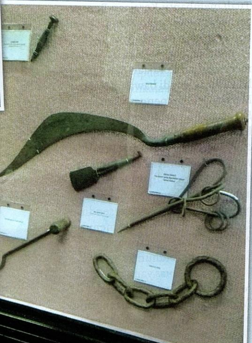
Anak dabus dan rantai besi dari Kampung Changkat Beruas dipamerkan di Muzium Beruas.

Sultan Malik Al-Salih menyerahkan takhta Kerajaan Pasai kepada Sultan Malik Al-Mahmud setelah kedua-dua putera Sultan Muhammad Az-Zahir dewasa. Takhta Kerajaan Samudera pula diserahkan kepada Sultan Malik Al-Mansur pada tahun 1336. Pada tahun 1346, Sultan Malik Al-Mahmud menyerang dan mengusir Sultan Malik Al-Mansur dari Kerajaan Samudera.