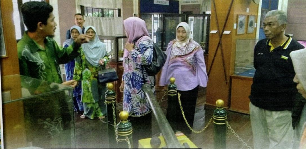
Sebahagian daripada pengunjung Muzium Beruas mendengar penerangan ringkas oleh kurator muzium.