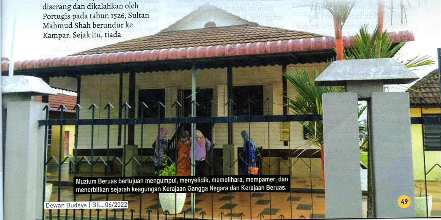
Muzium Beruas bertujuan mengumpul, menyelidik, memelihara, mempamer, dan menerbitkan sejarah keagungan Kerajaan Gangga Negara dan Kerajaan Beruas.

Muzium ini juga mempamerkan gambar pasu tembikar serta pecahan pasu dan tempayan tembikar, gambar batil tembaga (koleksi peribadi), bekas perasap kemenyan tembaga, kacip tembaga (dijumpai di Kampung Pengkalan Damar), pecahan seramik jenis coklat (dari Kampung Pulau Meranti), pecahan seramik jenis biru dan putih, serpihan seramik biru dan putih (Kampung Pengkalan Damar) dan ketulan besi (Kampung Tanjong Ara), serta gambar kerja pengukuran kedalaman lesung batu dan kerja penelitian di makam Puteri Banian (Kampung Batu Hampar). DB