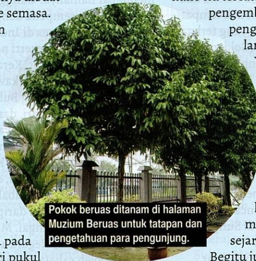
Pokok beruas ditanam di halaman Muzium Beruas untuk tatapan dan pengetahuan para pengunjung.

Begitu juga dengan Gangga Negara yang merupakan kerajaan kuno di Perak khususnya, dan di Malaysia amnya. Kerajaan Beruas dan Kerajaan Manjung wujud kemudian, iaitu semasa zaman Kesultanan Melayu Melaka. Maklumat berkenaan dengan Kerajaan Gangga Negara, Kerajaan Beruas dan Kerajaan Manjung tidak banyak diketahui. Ketiga-tiga kerajaan tersebut masih diselubungi begitu banyak misteri.