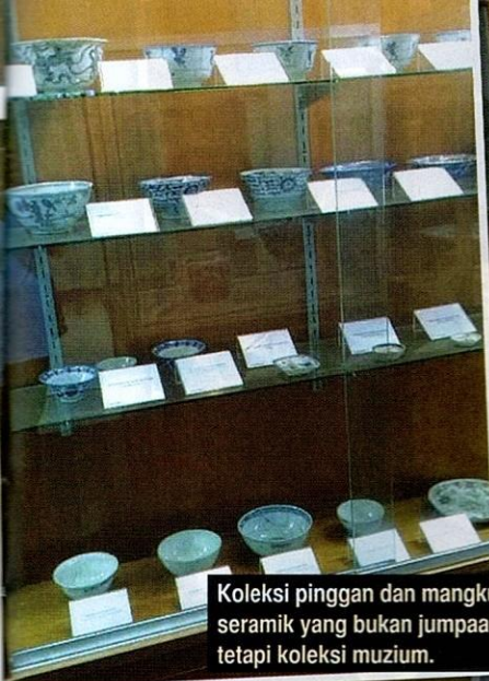
Koleksi pinggan dan mangkuk seramik yang bukan jumpaan, tetapi koleksi muzium.