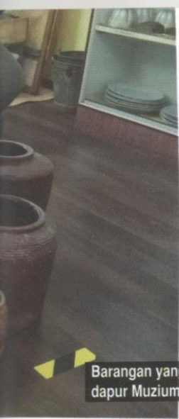
Barangan yang terdapat di ruang dapur Muzium Bugis.