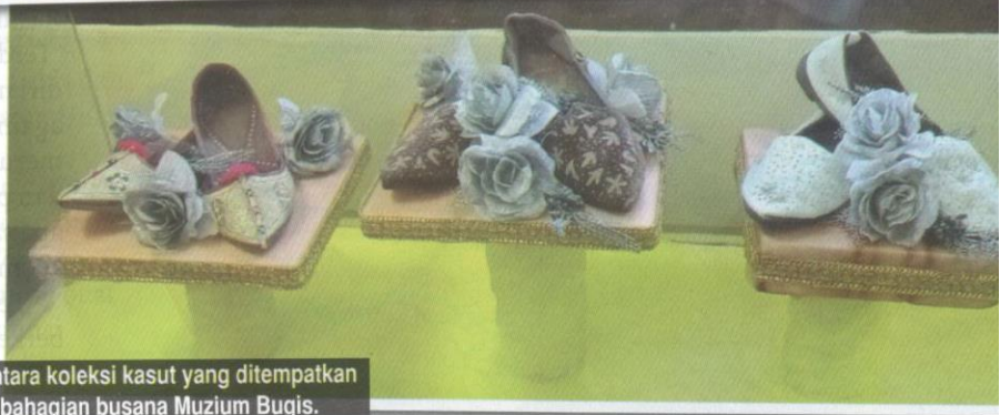
Antara koleksi kasut yang ditempatkan di bahagian busana Muzium Bugis.

“Baju ‘bodo’ merupakan antara busana pengantin yang dikenakan dengan warna sesuai ketika memakainya,” ujar Puan