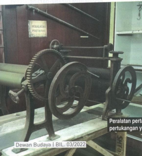
Peralatan pertanian dan pertukangan yang dipamerkan.