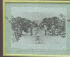
Koleksi foto lama yang terdapat di Muzium Bugis.