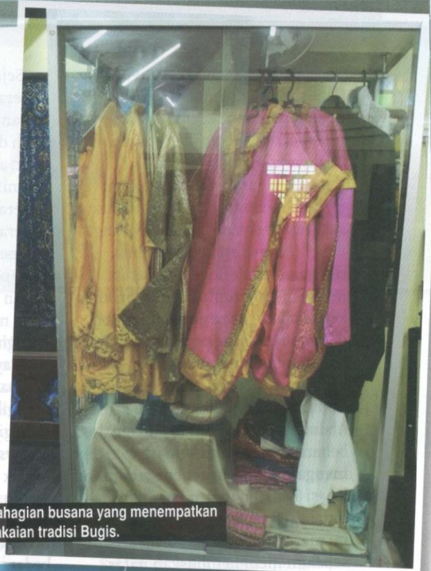
Bahagian busana yang menempatkan pakaian tradisi Bugis.

Bugis memainkan peranan yang penting dalam sejarah di Tanah Melayu. Mereka terlibat secara langsung atau tidak langsung di dalam politik dan perbalahan negeri-negeri Melayu ketika itu, terutama sekali negeri Johor. Ia bermula apabila Daeng Loklok ingin memerintah Johor tetapi tidak dipersetujui oleh pemerintah negeri Johor Riau Lingga ketika itu, iaitu Raja Kechil. Ini menyebabkan Daeng Loklok atau Bendahara Husain meminta bantuan Raja-Raja Bugis untuk menumpaskan Raja Kechil. Bermula dari sinilah campur tangan Bugis di Tanah Melayu. Malah, Raja Ali, anak Daeng Chelak, Raja Lumu, dinobatkan sebagai Sultan Selangor pertama