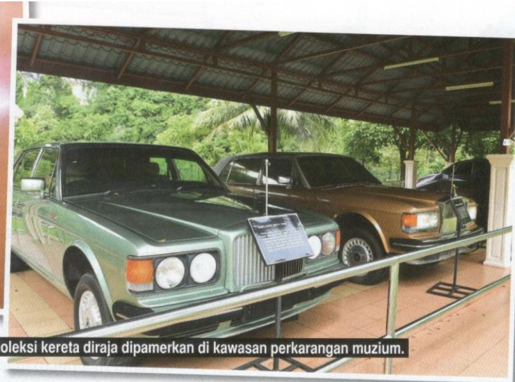
Koleksi kereta diraja dipamerkan di kawasan perkarangan muzium.

atau artifak menarik yang wajar diberikan perhatian termasuklah watakah pelantikan, baju perisai, pedang istiadat serta tengkolok.