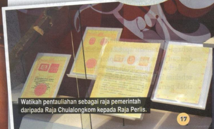
Watikah pentauliahian sebagai raja pemerintah daripada Raja Chulalongkorn kepada Raja Perlis.