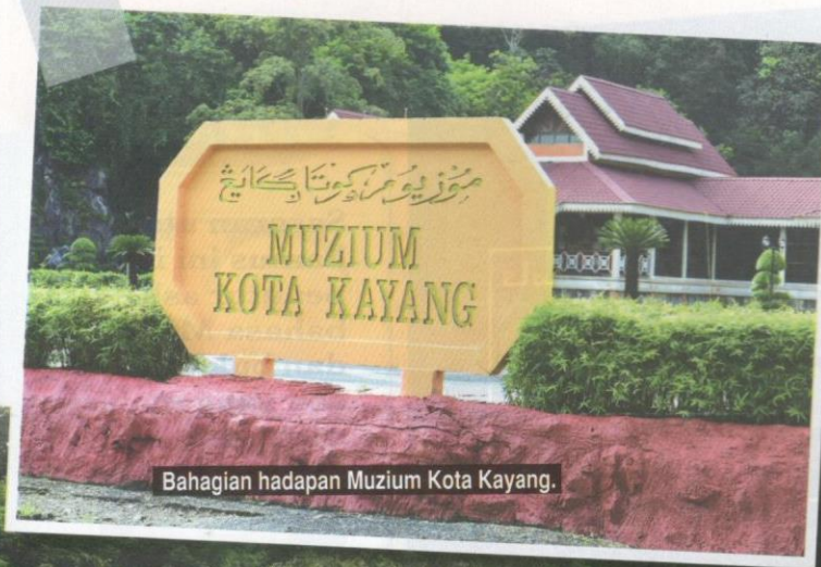
Bahagian hadapan Muzium Kota Kayang.

Perlis merupakan negeri yang menyimpan seribu khazanah rahsia sejarah dan tarikan alam semula jadinya. Satu daripada lokasi utama bagi tarikan sejarah budaya warisan ini ialah Muzium Kota Kayang yang merupakan muzium di bawah tadbir urus Jabatan Muzium Malaysia dan satu daripada agensi di bawah Kementerian Pelancongan, Seni dan Budaya Malaysia.