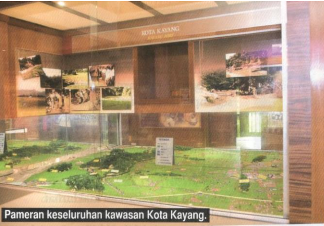
Pameran keseluruhan kawasan Kota Kayang.