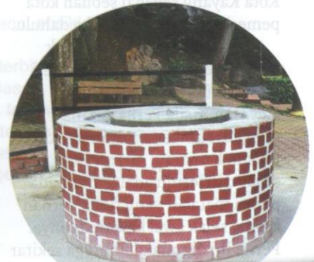
Perigi Diraja Kota Kayang.

Balai Diraja menelusuri turutan raja-raja yang pernah memerintah negeri Perlis. Koleksi peribadi baginda Tuanku dipamerkan untuk tatapan rakyat jelata di samping mendekati masyarakat dengan institusi diraja Perlis. Antara koleksi