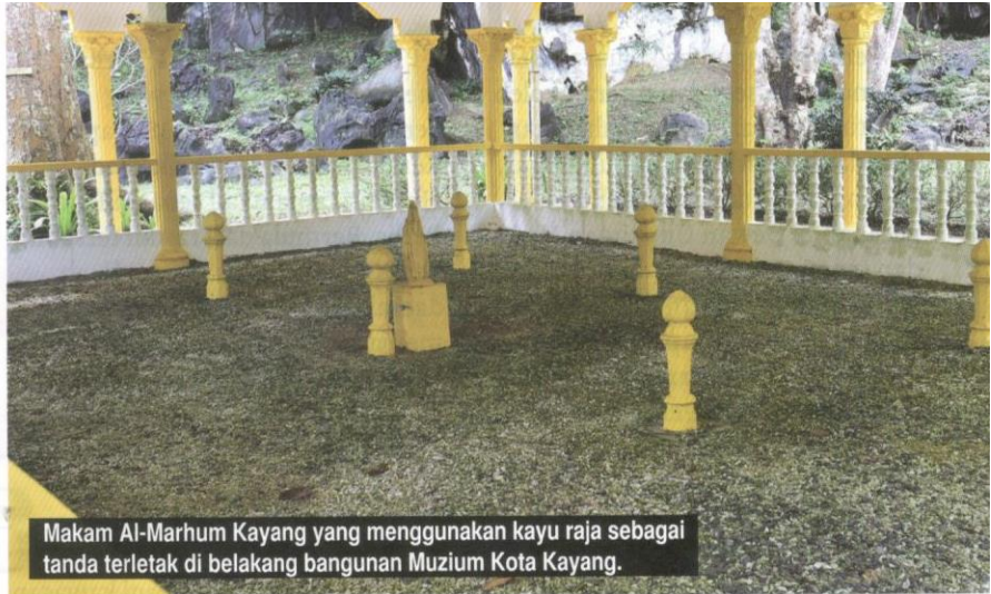
Makam Al-Marhum Kayang yang menggunakan kayu raja sebagai tanda terletak di belakang bangunan Muzium Kota Kayang.

Bangunan Muzium Kota Kayang dibina dalam dua fasa, iaitu; fasa satu dibina pada Mei 1999 dan siap pada September 2000. Reka bentuk muzium ini bercirikan istana zaman silam sebagai usaha menggamit memori para pengunjung kembali ke zaman kegemilangan kerajaan Melayu yang pernah bertapak di sini suatu masa dahulu selain disisipkan juga seni bina Melayu beridentiti Perlis, iaitu Rumah Bumbung Panjang Perlis. Dinding bangunan dihiasi kelarai yang diperbuat