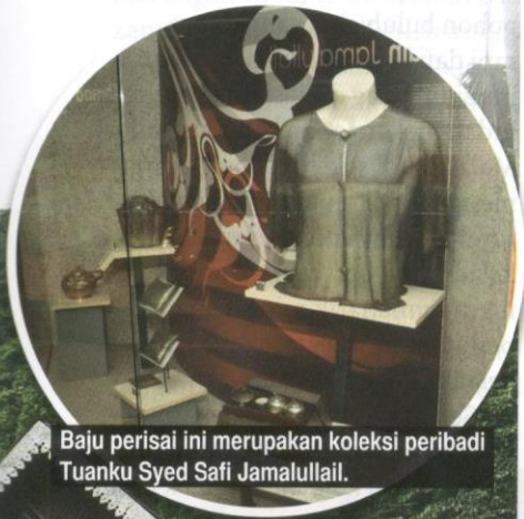
Baju perisai ini merupakan koleksi peribadi Tuanku Syed Safi Jamalullail.

Walaupun bukti penemuan tembok ini telah tiada, namun serba sedikit tinggalannya di kawasan sekitar kota masih tersisa antaranya makam dan perigi diraja di Kota Kayang. Tidak keterlaluan dikatakan bahawa kewujudan kota secara hasil gabungan alam semula jadi memperlihatkan betapa tingginya ilmu dan ikatan masyarakat Melayu silam yang bijak menyatukan alam dan situasi semasa. Kota ini pada masa yang sama menjadi tempat penyamaran dan perdagangan yang sesuai serta menjadi satu daripada bukti kearifan tempatan masyarakat Melayu suatu ketika dahulu.