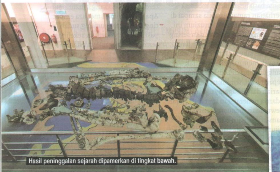
Hasil peninggalan sejarah dipamerkan di tingkat bawah.

Terdapat pelbagai koleksi yang menarik minat pengunjung seperti alat batu zaman paleolitik, alat bifas dan unifas, peralatan untuk penyelidikan, koleksi barangan masyarakat orang asli serta corak kehidupan manusia prasejarah. Selain itu juga, pengunjung dapat melihat dengan jelas tentang lukisan yang terdapat pada dinding gua, serta tempat kajian terhadap tapak arkeologi yang sezaman dengan Lenggong. Pada masa yang sama, pengunjung boleh melihat dengan lebih dekat alat pengebumian pada zaman neolitik seperti tembikar, alat batu perhiasan diri, acuan, kapak