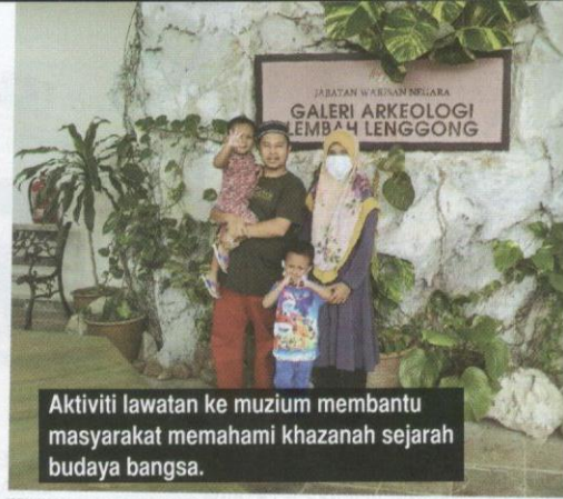
Aktiviti lawatan ke muzium membantu masyarakat memahami khazanah sejarah budaya bangsa.

Di sini terdapat banyak artifak dan maklumat tentang zaman prasejarah terutama yang berkaitan dengan kawasan di