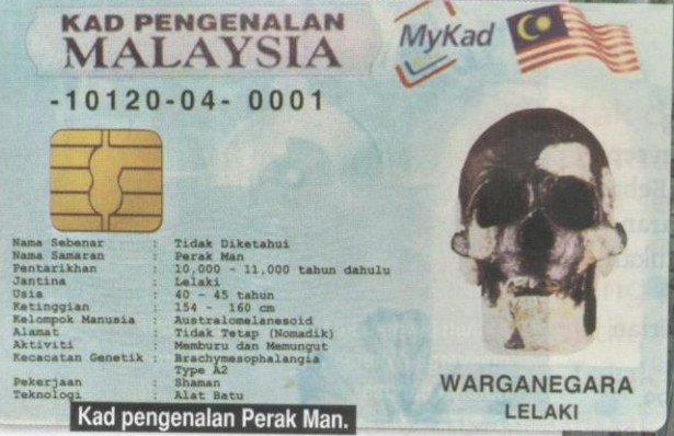
Kad pengenalan Perak Man.