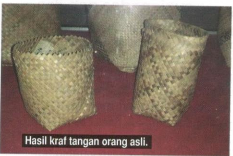
Hasil kraf tangan orang asli.