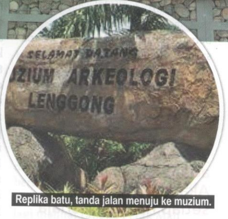
Replika batu, tanda jalan menuju ke muzium.

dan diberikan kad pengenalan diri. Dengan penemuan itu juga, para pengkaji telah menemui beberapa lagi kawasan di Lembah Lenggong yang amat kaya dengan gua dan bukit batu kapur. Hal ini menyebabkan Lenggong yang terletak sekitar 100 kilometer ke utara bandar Ipoh, menjadi tempat yang amat berharga dan "permata" di Hulu Perak.