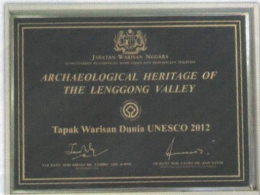
Plak tanda Tapak Warisan Dunia.

tamadun manusia dan juga Malaysia pada zaman sekarang. Bahkan turut dipamerkan salinan sijil yang menunjukkan Lembah Lenggong diiktiraf sebagai satu daripada tapak warisan dunia sehinggakan pengunjung yang berasal dan lahir di negeri Perak pasti berbangga. Sebuah menara tinjau juga terdapat di belakang muzium ini. Apabila berada di menara empat tingkat ini, pengunjung sudah pasti melihat kawasan sekeliling termasuk Sungai Perak dan