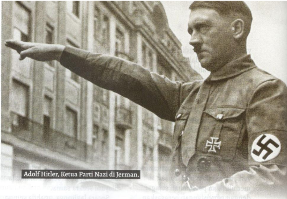
Adolf Hitler, Ketua Parti Nazi di Jerman.

Oleh sebab itu, bagi Jürgen Habermas, sekiranya patriotisme itu hendak dibangunkan, ianya haruslah berasaskan kepada prinsip persamaan sejagat dengan fasal