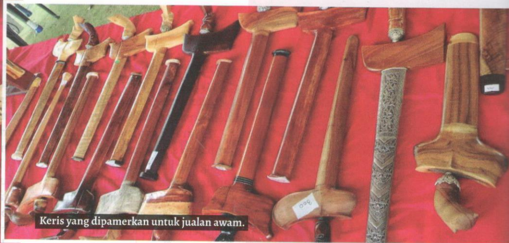
Keris yang dipamerkan untuk jualan awam.

Begitu juga dengan keris Sempena Riau yang dihadiahkan oleh Sultan Mahmud Shah kepada Laksamana Perwira Jaya selepas tamat perlawanan dengan Panglima Ali. Kedua-dua keris tersebut merupakan senjata kebesaran dan kebanggaan diraja pada masa tersebut. Begitulah juga dengan keris lain mempunyai sejarahnya yang tersendiri.