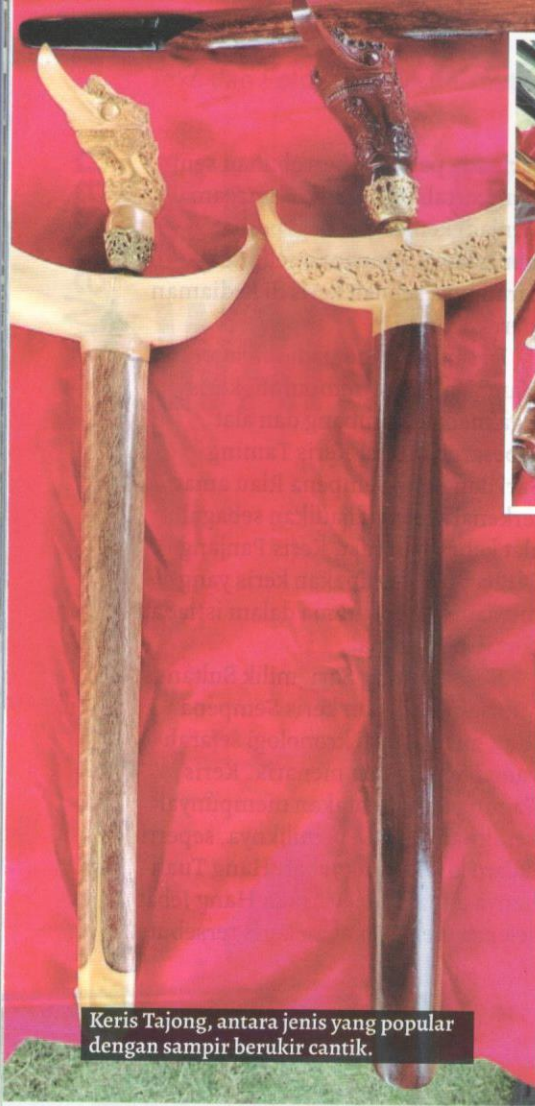
Keris Tajong, antara jenis yang popular dengan sampir berukir cantik.