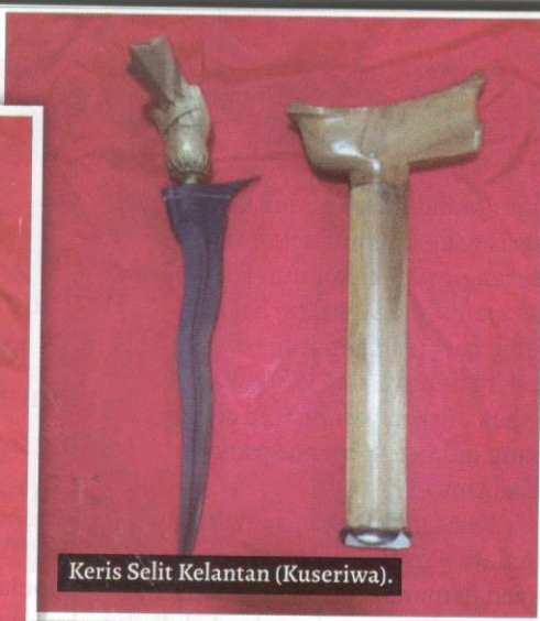
Keris Selit Kelantan (Kuseriwa).

Dalam acara rasmi dan kebesaran, keris terus unggul menjadi simbol dan pendahulu acara. Keris Panjang Diraja merupakan alat kebesaran pertabalan Yang Dipertuan Agong. Keris bersalut emas daripada bahagian hulu hingga sampir ini menjadi lambang kerajaan persekutuan dan 13 negeri yang bernaung di bawahnya.