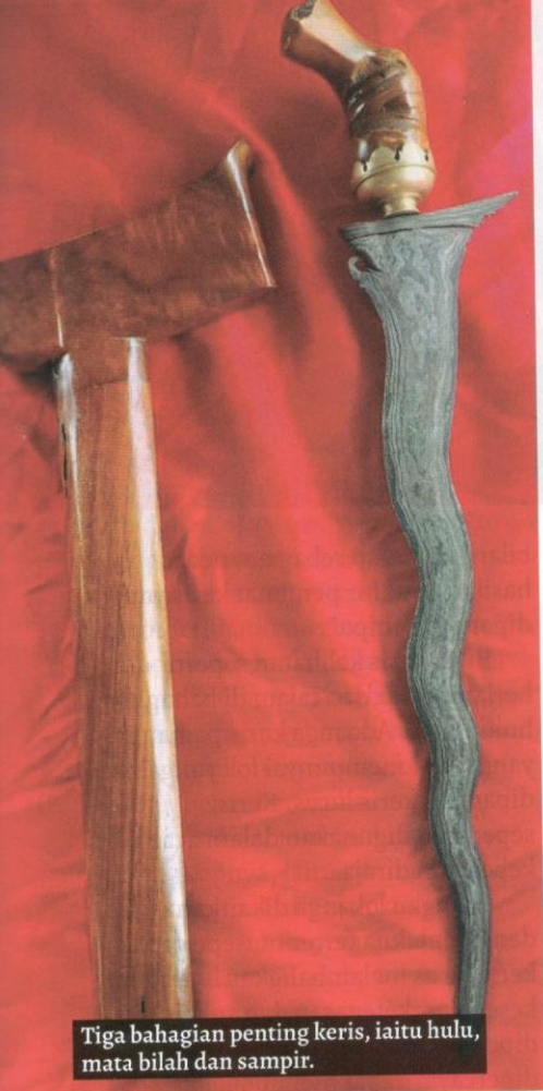
Tiga bahagian penting kris, iaitu hulu, mata bilah dan sampir.

lagi. Hal ini mungkin disebabkan oleh terpengaruh dengan cerita filem kepahlawanan dahulu, seperti filem Semerah Padi dan Hang Tuah .