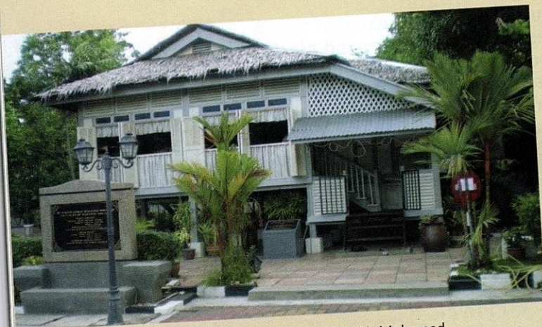
Kompleks Rumah Kelahiran Mahathir Mohamad.