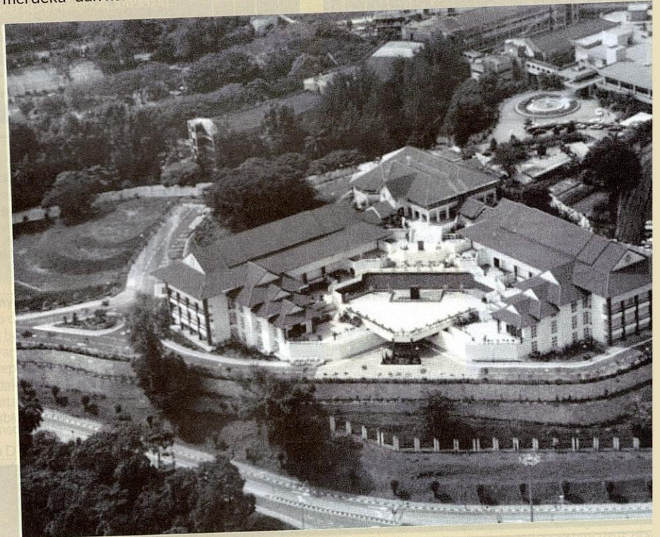
Pemandangan dari udara Memorial Tunku Abdul Rahman.

Terletak di Jalan Dato' Onn, Kuala Lumpur, Memorial Tunku Abdul Rahman telah dirasmikan pembukaannya pada 10 November 1994 oleh Perdana Menteri, YAB Dato' Seri Dr. Mahathir Mohamad. Memorial ini dibangunkan bagi memperingati, mengenang jasa dan sumbangan Perdana Menteri yang pertama, Almarhum Tunku Abdul Rahman Putra al-Haj, yang juga dikenali sebagai Baba Kemerdekaan. Antara yang menarik di memorial ini termasuklah terdapatnya sebuah bangunan "Residensi" berusia lebih 120 tahun yang masih dikekalkan bentuk asal dan kedudukan susun atur dalamannya untuk tatapan pengunjung. Selain itu, turut dipamerkan "Merdeka" dan kereta Cadillac Fleetwood 1959 yang pernah digunakan oleh Almarhum Tunku Abdul Rahman.