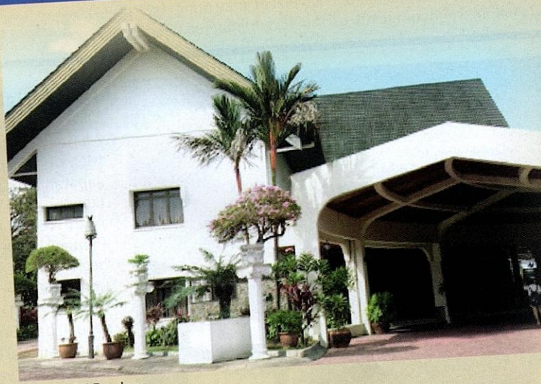
Galeria Sri Perdana.

Dirasmikan pada 20 Disember 2003 oleh Perdana Menteri, YAB Dato' Seri Abdullah Ahmad Badawi. Galeria Sri Perdana ini merupakan kediaman rasmi Tun Dr. Mahathir Mohamad bersama-sama keluarga dari tahun 1983 sehingga beliau berpindah ke Putrajaya pada tahun 1999, iaitu ketika beliau menjawat jawatan sebagai Perdana Menteri Malaysia keempat. Kini, Galeria Sri Perdana dibangunkan menjadi sebuah galeria yang mempamerkan koleksi khas Tun untuk tatapan umum. Yang menariknya, di sini juga terdapat bilik tukang berserta koleksi hasil tukang. Tun yang jarang-jarang diketahui umum, juga turut dipamerkan untuk tatapan pengunjung.