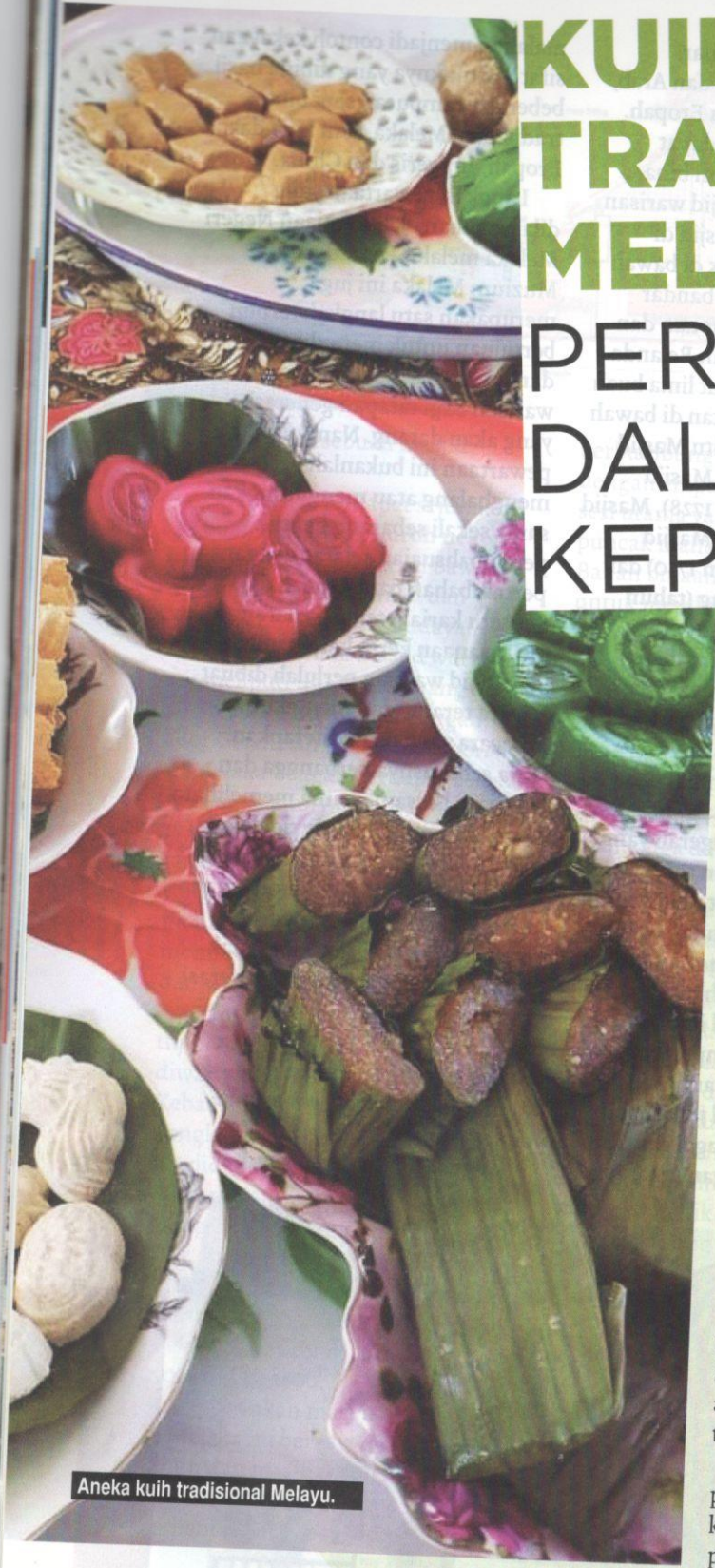
Aneka kuih tradisional Melayu.

A pabila mengadakan kenduri atau majlis perayaan, sudah pasti antara menu sampingan yang menjadi keutamaan termasuklah kuih-muih. Yang menariknya, kuih-muih tradisional sering kali menjadi penambat hati dan pembuka selera bagi tetamu yang hadir. Bagi mereka yang tidak mahu menikmati “makanan berat”, sekadar menjamah kuih-muih sudah memadai.