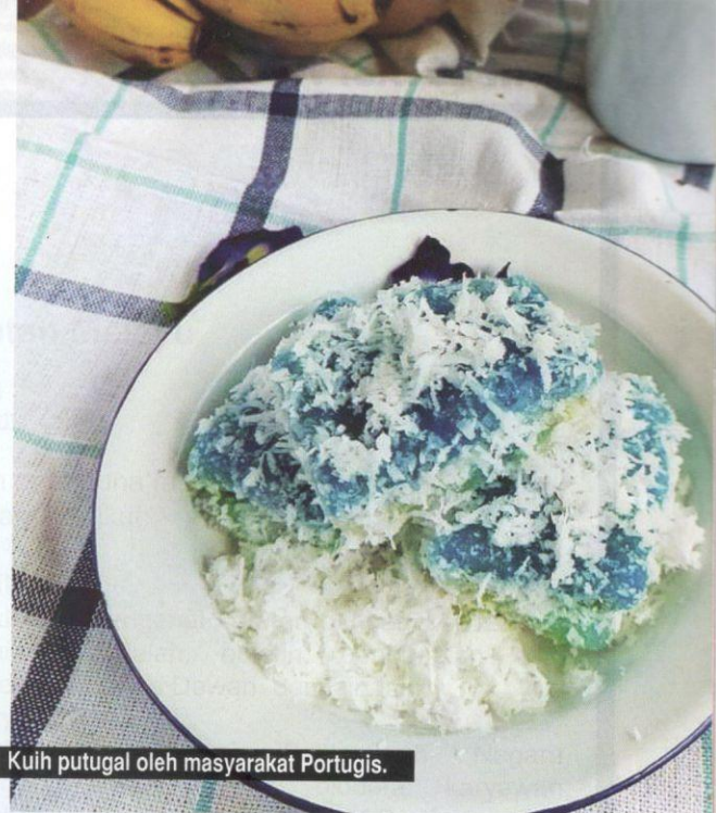
Kuih putugal oleh masyarakat Portugis.

Buku ini merupakan satu daripada usaha PERZIM untuk memelihara kuih-muih tradisional dengan mendokumentasikannya dalam bentuk buku. Sejak tahun 2004, PERZIM telah mengadakan Festival Masakan Warisan Melaka di Jalan Kota, Bandar Hilir yang sememangnya menjadi acara tahunan yang dinanti-nantikan