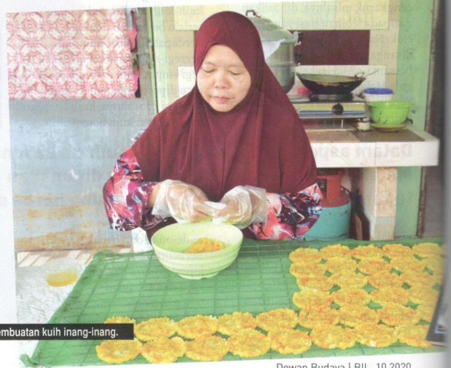
Pembuatan kuih inang-inang.

Yang lebih menarik, kepelbagaian kuih-muih etnik di Melaka ini merupakan kuih yang sama, namun berbeza dari segi nama. Perbezaan ini dapat dilihat