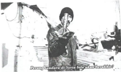
Perang saudara di Syria bila akan berakir?

terhadap Empayar Rom apabila Khilafah Uthmaniah menakluk Constantinople yang menjadikannya Istanbul.