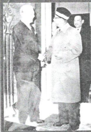
Tunku Abdul Rahman mengunjungi kediaman rasmi Macmillan di Downing Street, London.