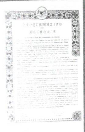
Pengisytiharan Malaysia, yang ditandatangani oleh Tunku Abdul Rahman.