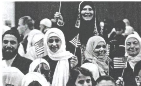
Dalam siri kempennya, Trump banyak mencetuskan sentimen anti-Islam.

Persoalannya, sekiranya Clinton dipilih sebagai Presiden AS, adakah beliau akan lebih toleransi terhadap umat Islam dan membantu negara Islam yang ditindas, seperti Palestin? Adakah Trump sememangnya anti-Islam kerana memberikan amaran akan menghalau orang Islam keluar dari AS? Adakah kenyataannya semasa berkempen pada Jun 2016 melarang rakyat Malaysia memasuki AS lebih buruk daripada Clinton? Banyak pihak yang menganggap kenyataan provokatif Trump akan menjadi senjata yang memusnahkannya. Namun begitu, yang berlaku sebaliknya kerana pola pengundi Trump adalah dalam kalangan kulit putih, rasis, dan trauma dengan orang Islam yang dijadikan bahan propaganda AS oleh Bush dan Obama sendiri. Mereka