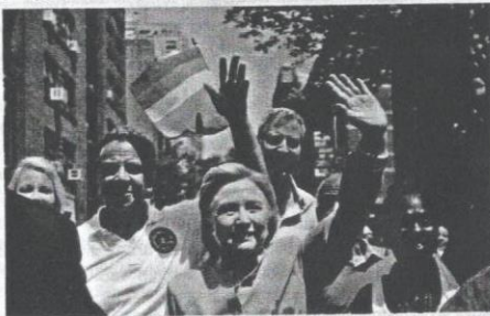
Clinton penyokong tegar LGBT.

Penyokong Clinton gembira dengan kenyataan provokatif Trump semasa berkempen kerana percaya hal itu akan membuatkan rakyat menolak Trump. Misalnya, sikap Trump yang seolah-olah berada dalam keadaan "separuh sedar" tentang realiti politik mengugut mahu menghalau semua orang Islam keluar dari AS sebagai ekor serangan penganas di Perancis.