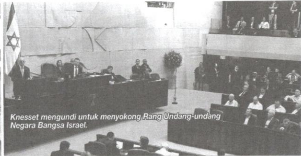
Knesset mengundi untuk menyokong Rang Undang-undang Negara Bangsa Israel.