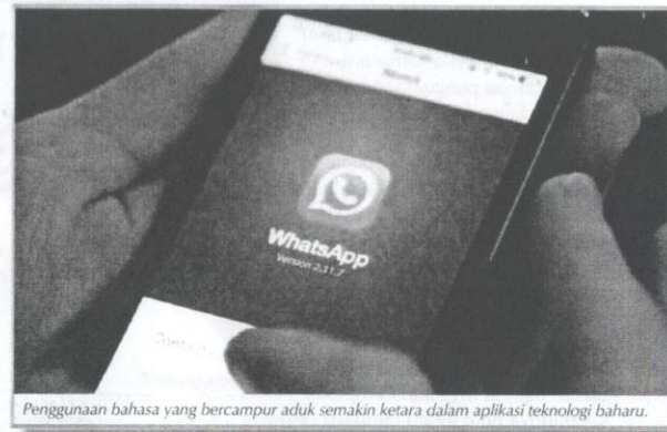
Penggunaan bahasa yang bercampur aduk semakin ketara dalam aplikasi teknologi baharu.

Pihak lain pula berpendapat bahawa istilah baharu sebagai variasi istilah asalnya dalam bahasa Inggeris tidak mampu menarik minat orang ramai untuk menggunakannya, malah ada yang mendakwanya sebagai janggal. Kebanyakan pengguna dikatakan lebih cenderung untuk memilih istilah daripada bahasa asalnya. Situasi ini menimbulkan kebingungan dalam sesetengah pihak sehingga ada yang beranggapan bahawa kemajuan teknologi tersebut merupakan cabaran besar terhadap