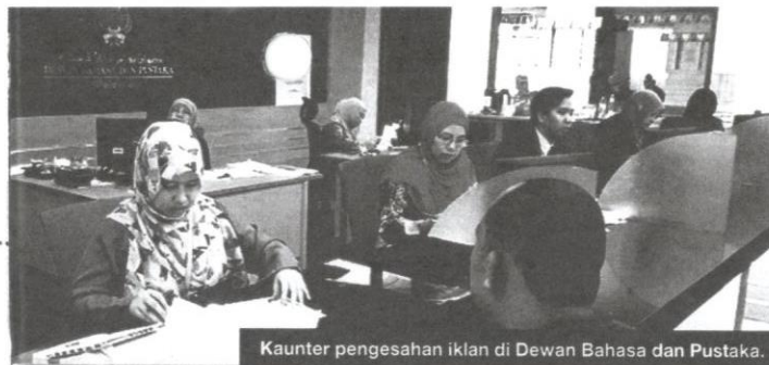
Kaunter pengesahan iklan di Dewan Bahasa dan Pustaka.