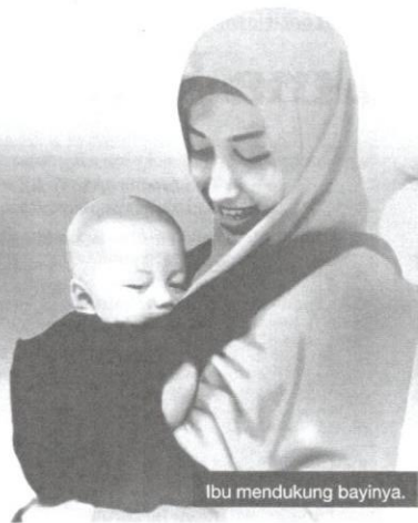
Ibu mendukung bayinya.

untuk menggunakan perkataan cancang dengan perkataan yang tepat dan ejaan yang betul. Walau bagaimanapun, kesan penggunaan dan sebutan yang menjadi kelaziman, perkataan seperti garuda , ehsan , cincang , istirehat dan mustika sering juga digunakan oleh pengguna bahasa untuk merujuk maksud geroda , ihсан , cancang , istirahat dan mestika .