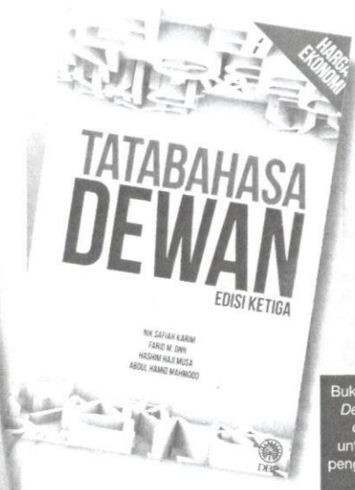
Buku Tatabahasa Dewan sesuai digunakan untuk panduan penggunaan bahasa Melayu.

Antara binaan ayat dalam bahasa Melayu yang menarik untuk dibincangkan ialah ayat pasif dan ayat songsang. Pengguna bahasa Melayu memilih kedua-dua gaya binaan ayat itu mengikut tujuan masing-masing dan untuk menekankan sesuatu keadaan atau hal.