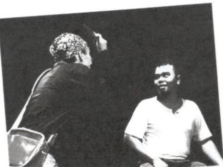
Bahasa dalam dunia lakonan juga mempengaruhi pemikiran penonton.

K esantunan bahasa dalam berkomunikasi sememangnya dititikberatkan oleh masyarakat kita, terutamanya orang Melayu. Nilai budi bahasa inilah menjadi adat dan amalan orang Melayu yang sememangnya amat selari dengan tuntutan ajaran Islam. Namun, nilai ini seakan-akan hilang ditelan arus kemodenan dan segala kempen yang dianjurkan oleh kerajaan berkaitan dengan budi bahasa seolah-olah sekadar dipandang sebelah mata. Adakah kita terbawa-bawa oleh pemikiran luar atau terpengaruh dengan filem tempatan yang menggunakan bahasa kasar, bahasa pasar dan bahasa rojak? Di manakah hilangnya kesantunan bahasa yang penting dalam bahasa Melayu dan juga tonggak keharmonian hidup masyarakat Malaysia?