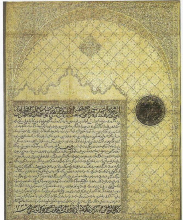
Warkah Sultan Ahmad dari Terengganu kepada Baron van der Capellen pada 19 Mac 1824.

Hal ini dikatakan demikian kerana tingkah laku atau maklum balas positif daripada penerima adakalanya bergantung terhadap rangsangan melalui ganjaran. Meskipun begitu, ganjaran bagi pengukuhan warkah yang dihantar tidak semestinya berbentuk benda, namun memadai hanya dengan ungkapan pujian mesra. Selain itu, menjadi kelaziman bagi masyarakat Melayu meraikan seseorang dengan penghargaan dalam bentuk hadiah, selari dengan konsep yang diajarkan oleh Islam. Dengan cara sebegini,