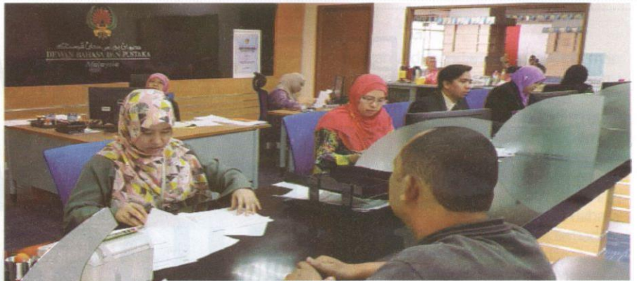
DBP mempunyai kepakaran dalam bidang bahasa dan sebagai pusat rujukan bahasa orang awam.

Yang kedua, kemungkinan juga ada pihak yang memang tegar jiwa, fikiran dan ego mereka kepada bahasa Inggeris (BI), lantas beranggapan segala ilmu itu hanya dapat diajarkan, dipelajari dan dikuasai berpenghantarkan BI, dan mereka yang berpendidikan BM itu standardnya lebih rendah daripada yang berpendidikan BI. Orientasi sikap dan fikiran demikian sudah tentu menyebabkan kalangan tersebut mencari seribu satu alasan untuk menidakkan kewibawaan BM, dan cenderung untuk memandang remeh usaha serta gerakan mempertahankan kedudukan dan kewibawaan BM sebagai bahasa rasmi, khususnya sebagai bahasa penghantar pendidikan dan bahasa yang melambangkan kedaulatan serta jati diri sesuatu bangsa, dan sesebuah negara yang merdeka. Puak-puak inilah, pada hemat penulis, yang masih giat mempromosikan Pengajaran dan