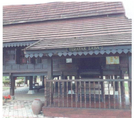
Teratak Za'ba merupakan satu daripada produk pelancongan pendidikan yang terdapat di Negeri Sembilan.

Penulis ini turut menghasilkan puisi "Za'ba Pendeta Bangsa", "Za'ba Lentera Cendekia", "Ketika itu, Za'ba", "Gurindam Peribadi Pendeta I", "Gurindam Peribadi Pendeta II" dalam kumpulan puisi Mengutip Manik Waktu yang Masih Tersisa pada tahun 2006 terbitan Dewan Bahasa dan Pustaka; dan bersama-sama Persatuan Penulis Negeri Sembilan mengendalikan aneka kegiatan pengisian program Jasamu Dikenang, Titipan Za'ba dan yang berkaitan, seperti bengkel bahasa, bengkel penghasilan puisi patriotik, bengkel deklamasi puisi, deklamasi puisi patriotik dan forum.