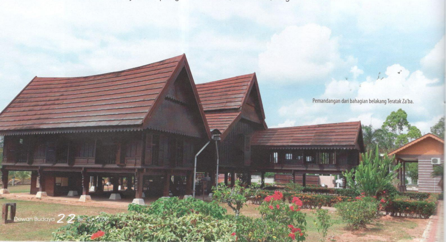
Pemandangan dari bahagian belakang Teratak Za'ba.

Teratak Za'ba ialah pustaka atau memorial yang menghimpunkan khazanah warisan Allahyarham Tan Sri (Dr.) Pendeta Haji Zainal Abidin Ahmad, atau dikenali sebagai Za'ba, di desa kelahirannya, Kampung Bukit Kerdas, Batu Kikir, Negeri Sembilan.