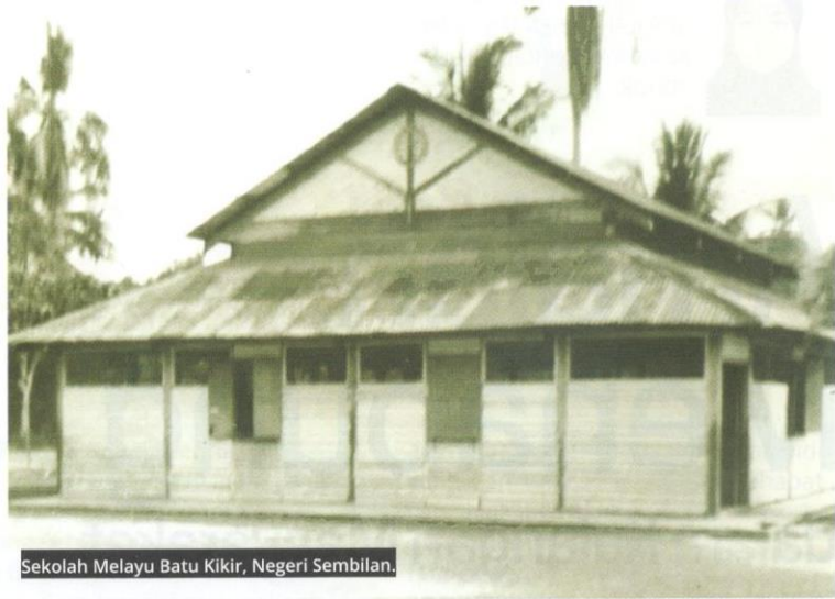
Sekolah Melayu Batu Kikir, Negeri Sembilan.