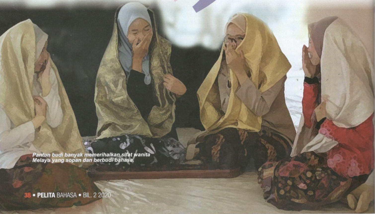
Pantun budi banyak memerihalkan sifat wanita Melayu yang sopan dan berbudi bahasa.

Hal ini bertujuan mengelakkan berlaku pertelingkahan dan akhirnya mencetuskan pergaduhan antara