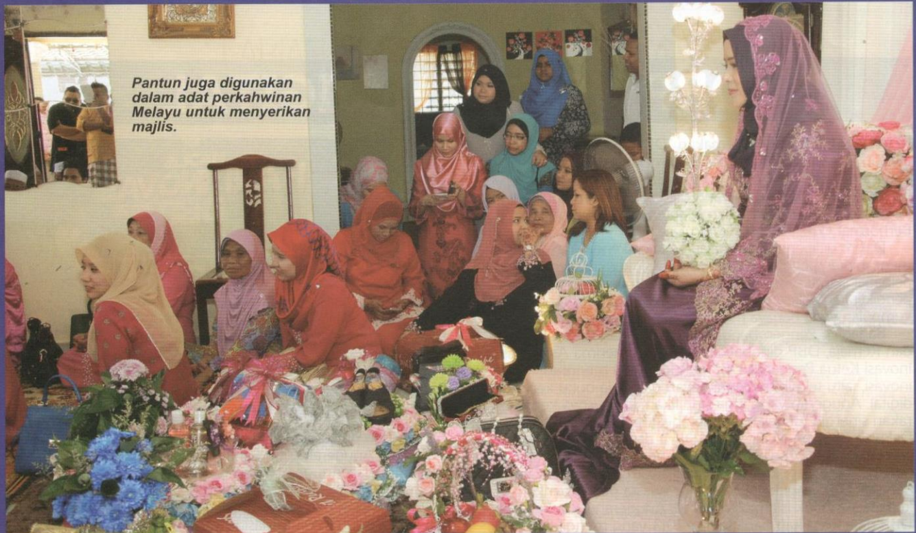
Pantun juga digunakan dalam adat perkahwinan Melayu untuk menyerikan majlis.

mereka. Masyarakat kita yang tidak suka menimbulkan masalah perselisihan faham tetapi masih mahu memberi peringatan kepada orang lain sering menggunakan pantun sebagai jalan penyelesaiannya. Penggunaan pantun membolehkan hanya orang yang melakukan sesuatu tindakan yang salah itu memahaminya lalu berusaha untuk mengubah kesilapannya pada masa hadapan. Oleh itu, pantunlah yang membantu masyarakat kita mengkritik ahli yang lain, tetapi masih mengekalkan suasana keharmonian dan kesejahteraan dalam sesebuah masyarakat. Sebagai contoh, pantun sindiran di bawah ini yang masih digunakan hingga sekarang: