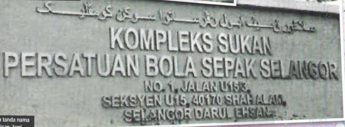
Papan tanda nama bertulisan Jawi.