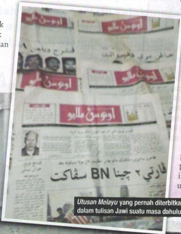
Utusan Melayu yang pernah diterbitkan dalam tulisan Jawi suatu masa dahulu.

Beliau juga optimis inisiatif kerajaan, termasuk melalui inisiatif DBP, membudayakan minat masyarakat menulis dan membaca Jawi akan berjaya dengan kerjasama dan sokongan padu semua pihak, termasuk sekolah, institusi pengajian, syarikat penerbitan, karyawan, pertubuhan bukan kerajaan, ibu bapa dan masyarakat umum. DB