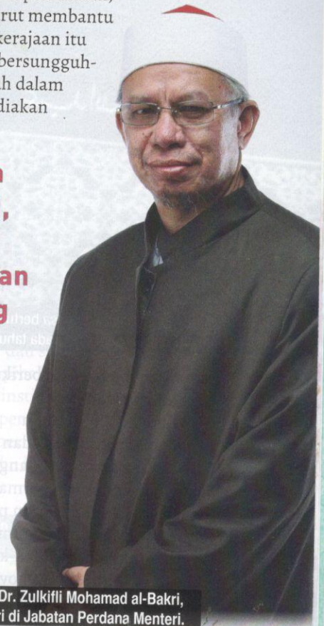
Datuk Dr. Zulkifli Mohamad al-Bakri, Menteri di Jabatan Perdana Menteri.

bahan penerbitan dalam tulisan Jawi untuk semua peringkat umur khususnya generasi muda. DBP selama ini telah pun menerbitkan banyak bahan bacaan bertulisan Jawi yang masih terdapat sedikit bakinya dalam pasaran, juga akan meneruskan usaha itu. Hal ini penting bagi memastikan bahan bacaan bertulisan Jawi sentiasa tersedia di pasaran atau perpustakaan bagi memenuhi