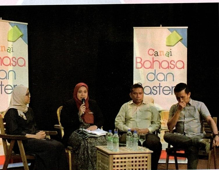
◀ Program "Canai Bahasa dan Sastera 2019" yang dilaksanakan oleh majalah Tunas Cipta .

Kini tiba masanya untuk kita membuktikan bahawa sastera dan perbukuan sedang hidup di dalam rumah kita masing-masing dan belum bersedia untuk mati, tetapi akan terus hidup untuk selama mana yang kita mahu. - tr