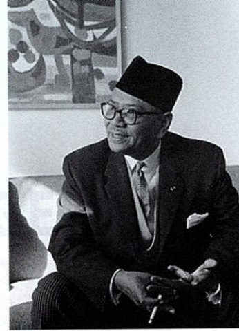
Tunku Abdul Rahman dikenali sebagai “Bapa Kemerdekaan” dan “Bapa Malaysia”.

“ Tunku Abdul Rahman pernah mengungkapkan falsafah yang penting tentang peranan bahasa kebangsaan sebagai roh bagi negara dan tanpa bahasa kebangsaan, negara umpama jasad tanpa roh. ”