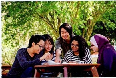
Bahasa Melayu menjadi wasilah pembangunan tamadun di alam Melayu.

Sokongan perlu diberikan kepada pengisytiharan Perdana Menteri untuk mengangkat martabat bahasa Melayu di dalam negara dan di pentas dunia. Perdana Menteri Malaysia pertama, Tunku Abdul Rahman Putra Al-Haj ibni Almarhum Sultan Abdul Hamid Halim Shah pernah