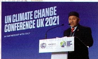
YB Dato' Sri Tuan Ibrahim, Menteri Alam Sekitar dan Air menggunakan bahasa Melayu ketika berucap di COP26, Scotland.

Pertemuan Perdana Menteri dengan wakil pejuang bahasa yang diketuai oleh Tan Sri Dato' Seri Utama Dr. Rais Yatim pada 10 Mac 2022 di Parlimen menjadi dialog percambahan fikiran untuk menggariskan hasrat Perdana Menteri dalam mengangkat bahasa Melayu di persada dunia, di samping memperkukuh kedudukan dan pelaksanaannya pada peringkat negara. Perdana Menteri turut mengemukakan gagasannya tentang martabat bahasa Melayu dalam ucapannya di Perhimpunan Agung UMNO pada 19 Mac 2022. Kemuncak hasrat Perdana Menteri itu ialah pernyataannya di sidang Dewan Negara pada 23 Mac 2022 yang menyebut iltizam dan usaha kerajaan untuk meningkatkan martabat bahasa Melayu pada peringkat negara dan dunia. Perkara yang disebut oleh beliau ialah usaha untuk menjadikan bahasa Melayu sebagai bahasa rasmi kedua ASEAN, pelaksanaan program Diplomasi Kebudayaan yang turut mencakup unsur pengembangan bahasa Melayu di persada dunia