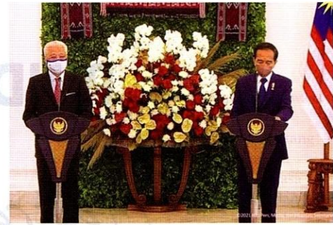
Presiden Jokowi menerima kunjungan Perdana Menteri Malaysia di Istana Merdeka, Jakarta.