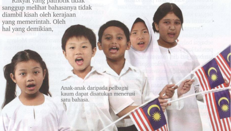
Anak-anak daripada pelbagai kaum dapat disatukan menerusi satu bahasa.

Sebagai rakyat yang bijak, kita mestilah membebaskan minda kita daripada pemikiran yang mengatakan bahawa bahasa Inggeris tersebut lebih baik daripada bahasa kita. Jika kita mengatakan bahawa bahasa Melayu tidak mampu berkembang pada masa ini, kita telah merendahkan martabat bahasa Melayu. Sampai bilakah kita hendak membebaskan diri kita daripada belunggu pemikiran penjajah? PB