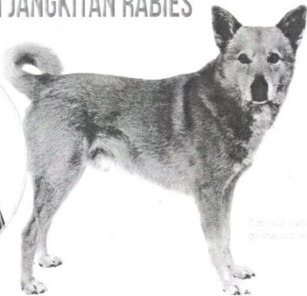
Terdapat rabies berisiko terkena akibat gigitan anjing liar di Kedah.