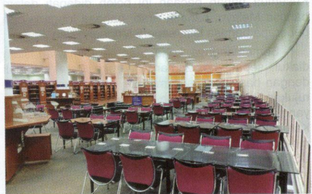
Ruang untuk pengunjung Perpustakaan USIM.

Memandangkan tiada sebuah perpustakaan awam yang lengkap dibina untuk orang awam di daerah Nilai hingga kini, maka atas rasa tanggungjawab terhadap masyarakat sekitar, mulai bulan Oktober tahun 2018, Perpustakaan USIM telah dibuka kepada orang awam, berbanding dengan sebelumnya yang hanya terhad kepada warga USIM sahaja dan warga universiti awam yang lain. Hal ini membolehkan orang ramai masuk ke Perpustakaan USIM secara percuma bagi menggunakan kemudahan ruang bacaan untuk membaca dan membuat rujukan. Perpustakaan ini menyediakan lebih 1500 tempat duduk untuk keselesaan pengunjung.