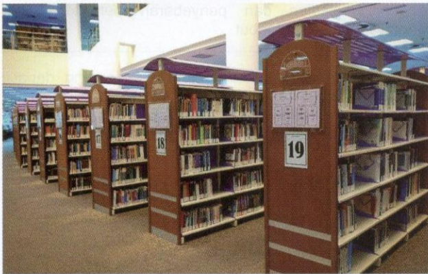
Rak terbuka Perpustakaan USIM.