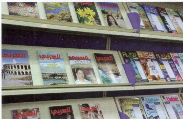
Rak koleksi majalah.

Bangunan Perpustakaan berketinggian empat tingkat ini juga menyediakan ruang yang sesuai untuk dinikmati. Bagi mereka yang ingin bersendirian, terdapat meja karek dan bilik karek disediakan khusus untuk mereka yang selesa membaca, atau membuat kerja secara individu, manakala bagi mereka yang datang secara berkumpulan atau suka membaca dengan suasana ramai orang, terdapat ruang bacaan yang terbuka untuk mereka. Sementara itu, bagi mereka yang ingin mengadakan perbincangan dalam bentuk berkumpulan dan tertutup, perpustakaan ini mempunyai 10 buah bilik perbincangan yang boleh ditempah mengikut keperluan.