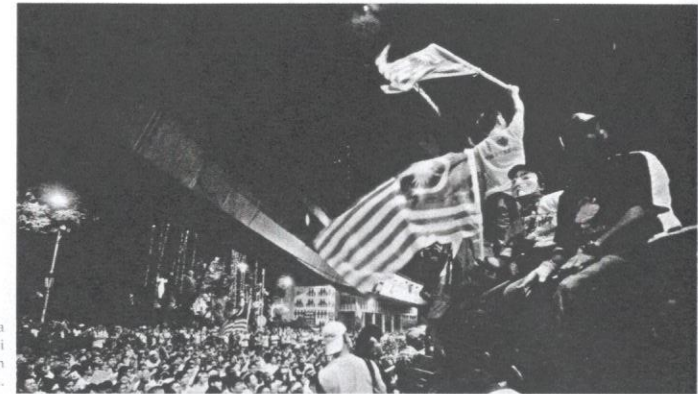
Peserta demonstrasi sengaja menimbulkan provokasi memburukkan pemimpin dan kerajaan.

Kaum Cina yang menyokong ideologi DAP rata-rata mencari dan membesar-besarkan segala keburukan dan kelemahan pemerintah. Kemakmuran, kemajuan, dan kejayaan negara hasil usaha parti pemerintah dipandang sepi dan tidak dihargai. Mereka rata-rata menolak pemimpin dan ideologi BN. Akibat daripada perbuatan ahli BERSIH yang tidak menghormati pemimpin Melayu, hal tersebut membangkitkan kemarahan orang Melayu. Hal itu ternyata tidak berakhir apabila perhimpunan PESAKA dengan menggunakan warna merah bertindak secara simbolik sebagai tanda amaran, protes, dan wakil suara kaum Melayu terhadap apa-apa yang dilakukan oleh demonstrasi BERSIH.