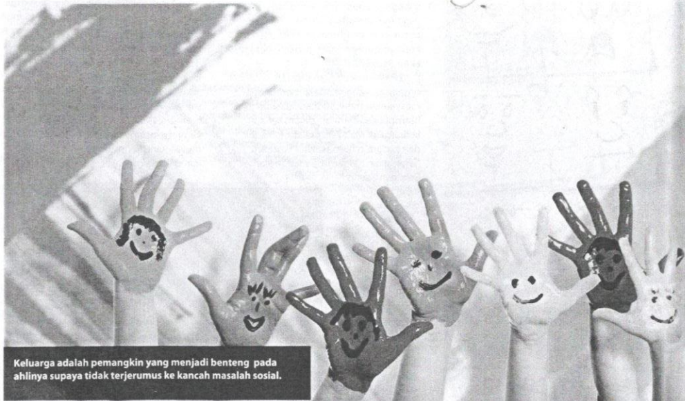
Keluarga adalah pemangkin yang menjadi benteng pada ahlinya supaya tidak terjerumus ke kancah masalah sosial.

gabungan modul yang disediakan oleh LPPKN yang meliputi Modul Permata Kasih, Eksplorasi Remaja, SMARTbelanja, SMARTSTART, Bahtera Kasih, Belaian Kasih, Mutiara Kasih dan Pop Komuniti yang merupakan antara kursus kokurikulum di IPT. Aktiviti yang dianjurkan oleh LPPKN melalui Modul Pembangunan Keluarga Institusi Pengajian Tinggi (IPT) dapat menyalurkan informasi yang berguna kepada remaja untuk mewujudkan keluarga bahagia.