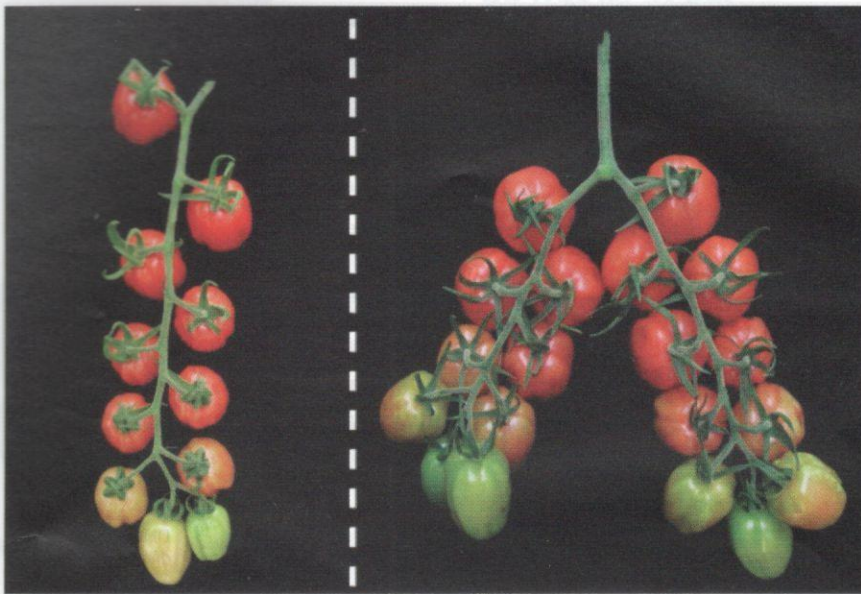
Rajah 2 Perbezaan jumlah pecahan ranting pokok dan bilangan buah tomato yang terhasil melalui penanaman biasa (kiri) dan teknologi CRISPR (kanan).

membawa gen yang menghasilkan capsaicin , yakni sejenis bahan yang menyebabkan lada berasa pedas. Penghasilan tomato pedas ini adalah untuk menangani kesukaran yang dihadapi dalam penanaman lada. Lada memerlukan persekitaran yang spesifik dan hasil tanaman lada lazimnya adalah lebih rendah daripada tomato.