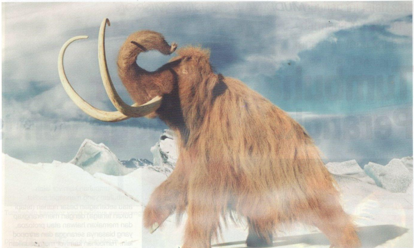
Haiwan terancam, woolly mammoth .

disebabkan oleh masalah genetik yang sering terjadi dalam kalangan baka anjing Dalmatian. Selain itu, CRISPR mungkin boleh digunakan untuk menghasilkan baka ikan koi mengikut saiz, warna, dan corak yang diingini.