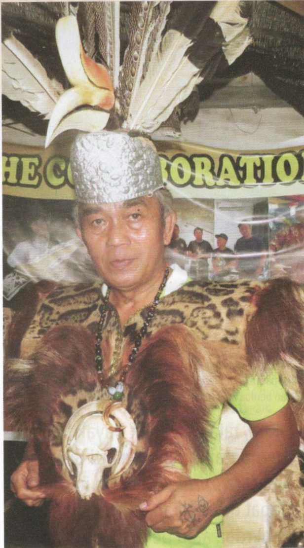
Pakaian tradisi yang dipanggil Gagong .

Dayak yang sudah menganuti apa-apa agama sekali pun. Oleh sebab tidak memahami adat, upacara miring semakin lenyap. Hal ini merupakan satu kesilapan besar yang menyebabkan perayaan Gawai semakin jauh daripada realiti sebenar.