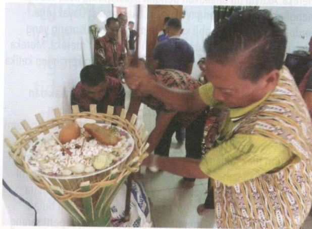
Alat ritual diletakkan di buluh ceracak yang dipanggil kelinggang .

Pada zaman lampau, perayaan Gawai sangat dikongkong oleh pantang larang keturunan dan alam. Oleh sebab itu, perayaan ini penuh dengan ritual keturunan yang masih diamalkan pada masa ini. Namun begitu, dekad yang panjang ini mencetuskan evolusi baharu yang mengganggu keaslian perayaan Gawai