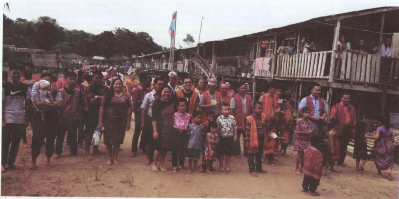
Penghuni asal rumah panjang yang bekerja di bandar pulang ke tempat asal mereka untuk menyambut Hari Gawai Dayak.