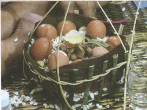
Alat upacara miring yang dipanggil pedarak .

Dayak. Perubahan yang dimaksudkan itu antaranya termasuklah apabila masyarakat Dayak menjadi penganut pelbagai agama, perkahwinan campur dan pertukaran identiti diri.