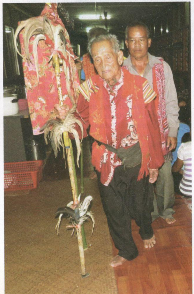
Tokoh upacara miring yang dipanggil lemambang .

Sepanjang sambutan Gawai Dayak, hiasan di sesebuah rumah panjang dapat dilihat bukan sahaja di ruai, bilik dan halaman, tetapi di sepanjang jalan masuk ke rumah tersebut. Bahagian ruai rumah panjang akan dihias dengan tinar berukiran tradisi dan diletakkan tiang pohon kayu berdaun daun atau pohon pisang yang dipanggil ranyai . Dahan pohon yang didirikan akan disangkut dengan hadiah dan apa-apa sahaja. Di bahagian tanju atau beranda pula, sesetengahnya dibina alat upacara, seperti