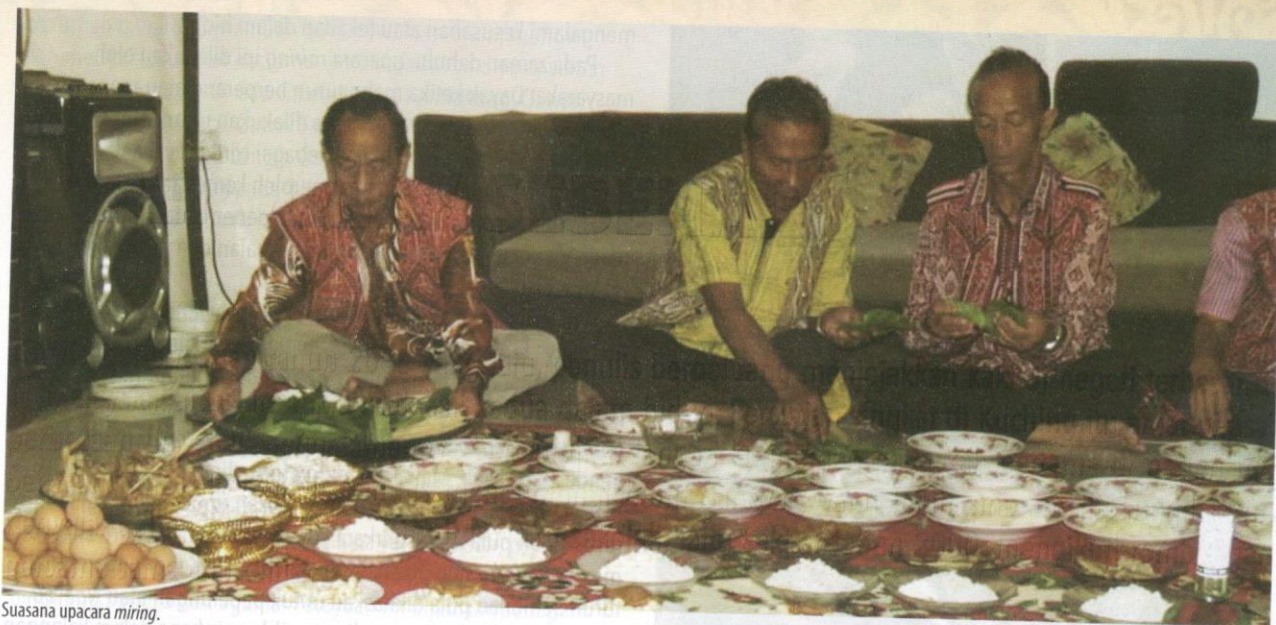
Suasana upacara miring .

batang buluh berceracak yang dianyam, untuk melakukan ritual adat mengikut keperluan sesebuah keluarga. Upacara sedemikian berbentuk ritual penyembuhan ahli keluarga yang kurang sihat.