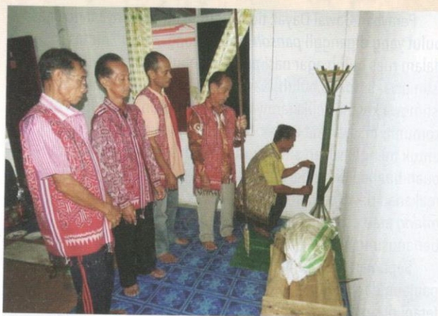
Acara mengorbankan haiwan.

"Hari Sarawak" oleh pemerintahan Rajah Brooke. Perayaan Gawai Dayak sebenarnya berlangsung selama sebulan, bermula dari hujung Mei sehingga hujung bulan Jun setiap tahun. Hari pertama perayaan jatuh pada 31 Mei dan hari kedua pada 1 Jun dan akan tamat secara rasmi dengan upacara penutupan pada akhir bulan Jun yang dipanggil menggulung atau ngiling tikar . Perayaan Gawai Dayak merupakan perayaan bagi masyarakat Iban (Dayak Laut) dan Bidayuh (Dayak Darat). Hal ini berbeza dengan subetnik masyarakat Dayak di Kalimantan yang turut merayakan perayaan Gawai setiap tahun.